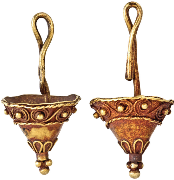
Рис. 1. Серезки типу «перекинутий конус» з костюмного комплексу небіжчиці на східній ділянці склепу Fig. 1. The «upside-down cone» type earrings from the costume complex of the female buried in the eastern part of the crypt

стави припустити, що в деяких могилах (всього у чотирьох) було двоє небіжчиків (Ильинская 1968, с. 43—53). Але це складає більше 20 % у некрополі. На жаль, зараз не всі матеріали, одержані під час досліджень, «дійшли» до нас. Йдеться про описи поховань, схеми розміщення артефактів, а також деякі з них.