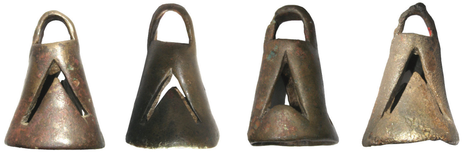
Fig. 10. Bronze bells in the shape of cut cones with rounded topsides

с. 174). Ці думки про застосування наверх вже не раз висловлювали дослідники і обґрунтовували створення особливого музичного «супроводу» під час поховальних обрядів (Фрунт 2023, с. 81—93).