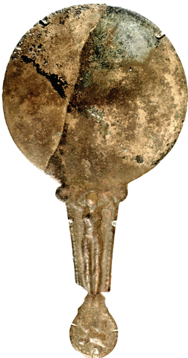
Рис. 8. Дзеркало із зображенням жіночого божества на ручці