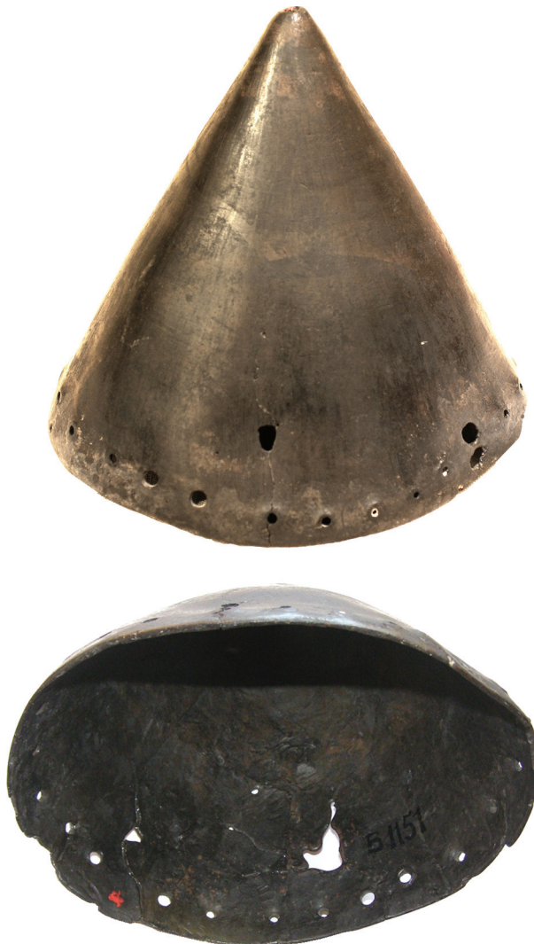
Рис. 9. Навершя у формі порожнистого конуса із бронзи

На цій же (східній) ділянці зафіксовано порожнистий бронзовий конус (висота 115 мм, діаметр 230 мм; рис. 9). Предмет відлитий з бронзи, поверхня добре заглажена, знизу по колу пробиті маленькі отвори. Крізь них до конуса, мабуть, були прикріплені бронзові литі ажурні дзвоники: 26 екз. (висота 60—63 мм; діаметр 36—44 мм) у вигляді зрізаних конусів із заокругленою верхівкою. На боках виробів — фігурні вирізи у формі трикутників, а також стрілоподібні (дві вузькі смужки, з'єднані під кутом вершиною ввєрх), завершення — велика петля (рис. 10). Такі ж дзвоники були прикрасами спорядження коней. За класифікацією О. Могилова, предмети належать до типу «зрізаноконічні дзвіночки (іноді з опуклими чи увігнутими боками та петлею)» (Могилов 2008, с. 86).