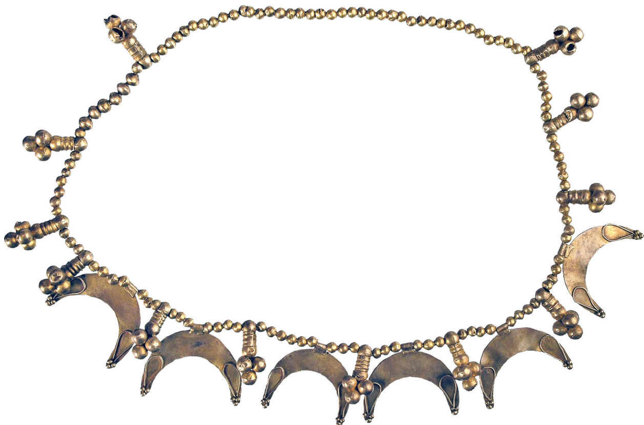
Рис. 5. Нашийна прикраса з костюма жінки, похованої на західній ділянці могили Fig. 5. Neck adornment of the female buried in the western part of the grave

вказані їх розміри і точне місце розміщення, то можна тільки зазначити, що за змістом трикутники (виноградні грона) входять до кола символів життєдайних богів. Схожі пластинки знайдено в кургані поблизу с. Будки (Ильинская 1968, табл. XXXIII: 23—26).