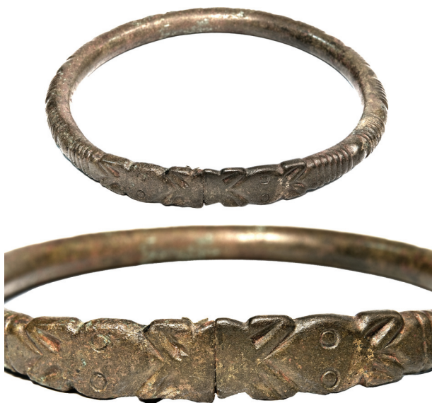
Рис. 2. Бронзовий ножний браслет із зооморфним оформленням закінчень