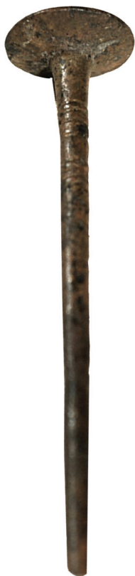
Рис. 6. Фрагмент шпильки з поховання на західній ділянці склепу

Шпильки були характерною ознакою вбрання жінок, які жили на території Лісосте-