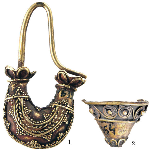
Рис. 4. Сережки з костюмного комплексу жінки на західній ділянці могили: 1 — сережка типу кораблик; 2 — сережка типу «перекинутий конус» (фрагмент)

Fig. 4. The earrings from the costume complex of the female from the western part of the crypt: 1 — boat type earring; 2 — «Upside-down cone» type earring (fragment)