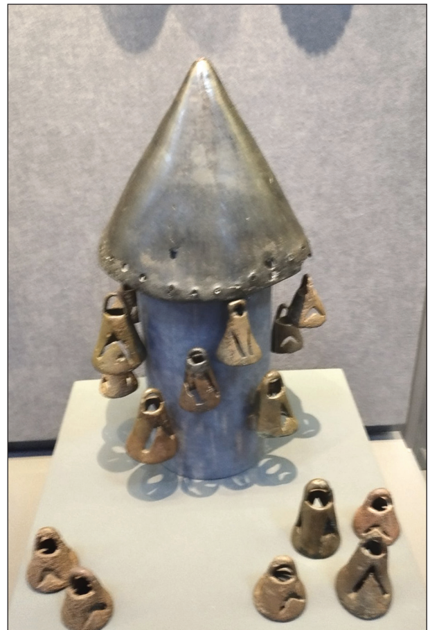
Рис. 11. Варіант реконструкції атрибута для поховальної церемонії

Як зазначив український дослідник В. Ятченко, хоча про шаманів читаємо у античних авторів, але послідовно і на новому рівні вивчення феномену почалося тільки в XX ст. (Ятченко