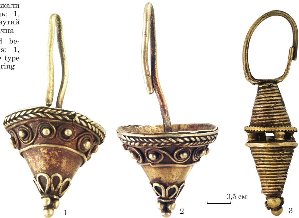
Fig. 7. Earrings, located between deadwomen heads: 1, 2 — the upside-down cone type earrings; 3 — biconical earring

та ін. 2021, кат. № 11, інв. № ДМ-6352; рис. 7: 1—3). Сережка нагадує геометричну фігуру, утворену двома конусами, з'єднаними основами, між якими напаяні чотири кульки зерні. Кожний конус виготовлено зі спіралью намотаних дротинок. До верхньої деталі припаяна дужка із круглого у перетині дроту, кінці якої заходять один за одного. Завершення нижнього конуса сережки — пірамідка з чотирьох кульок зерні (висота — 43 мм; ширина 11 мм; D дужки 16 × 11 мм; H підвіски 27 мм). На землях Скіфії, як підкреслила В. А. Іллінська, оздоба такої форми надзвичайно рідкісна, а областю поширення біконічних сережок є територія Інгушетії (Луговий могильник), тобто, можливо, подібні прикраси свідчать про певні зв'язки з Кавказом (Ильинская 1968, с. 140).