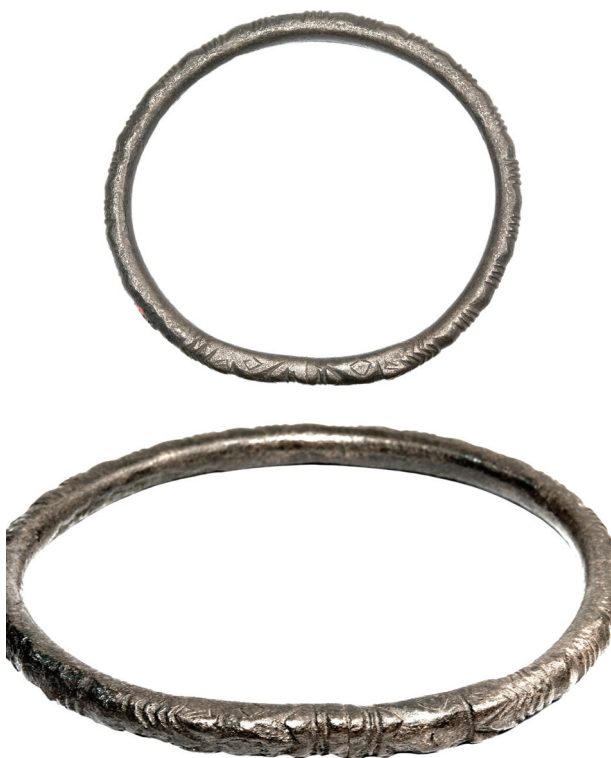
Рис. 3. Бронзовий ножний браслет, прикрашений рубчиками і зображеннями голів тварин на кінцях