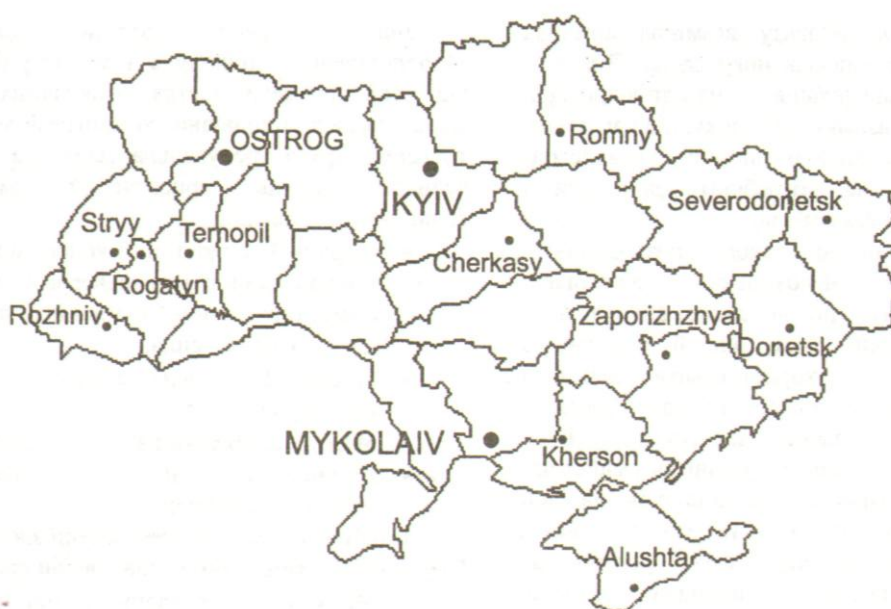
Рис. 2. Києво-Могиллянська мережа на мапі України

Оскільки мережа географічно поширена, вона спроможна розповсюджувати знання про інформаційні технології у школах всієї країни, що вже фактично робиться. Серед перших проявів такої діяльності - дві українські громадські організації: Вікно в світ та Українська бібліотечна асоціація - виявили готовність приєднатися до руху надання допомоги спеціалізованим школам для учнів з вадами зору. Відтак перелік методів усунення освітніх бар'єрів поповнений ще одним пунктом, відомим як адаптивні технології.