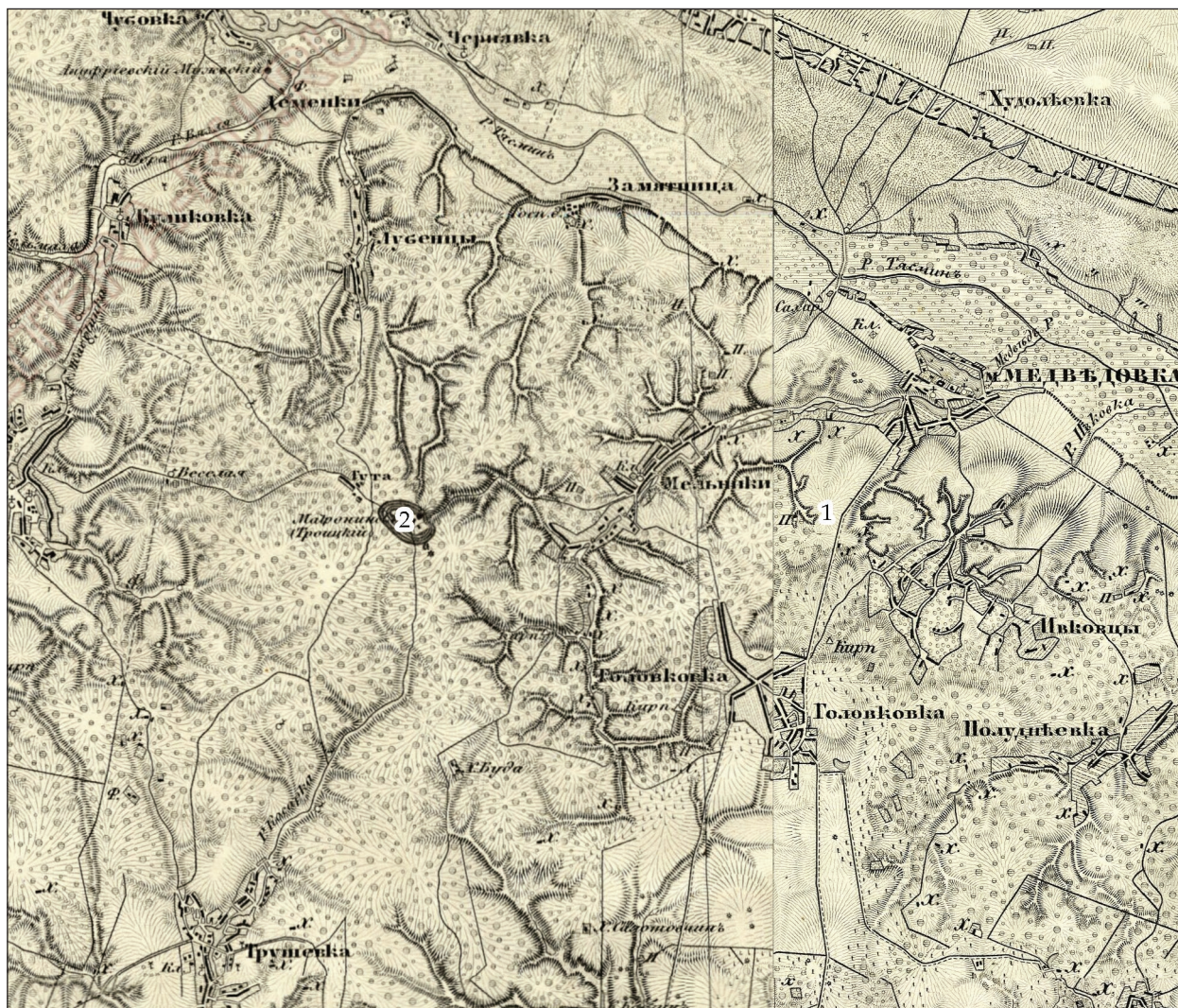
Рис. 1. Схема розташування поселенських структур у північно-східній частині лісового масиву Холодного Яру: 1 – поселення Погибельне; 2 – Матронинське городище

складає слабогумусований підзолистий лес, тобто в минулому всю територію поселення вкривав ліс, а не лише його найнижчу частину.