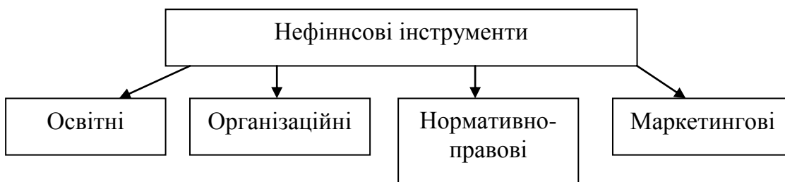
Рис. 2 – Нефінансові інструменти забезпечення розвитку та функціонування ТГ на засадах циркулярної економіки

Серед нефінансових важелів можемо виділити такі (див. рис. 2).