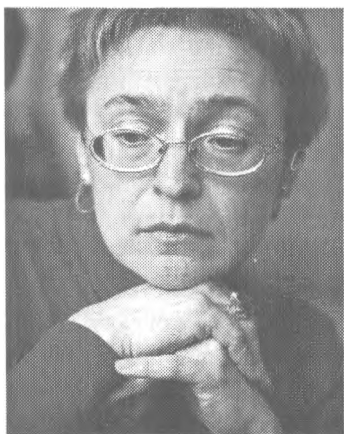
Анна Політковська (Мазепа) (1958–2006) — відома російська журналістка, борець за права людини і права народів. Автор декількох книжок про Чеченську війну та путінську Росію. Убита в ліфті свого будинку 7 жовтня 2006 р.