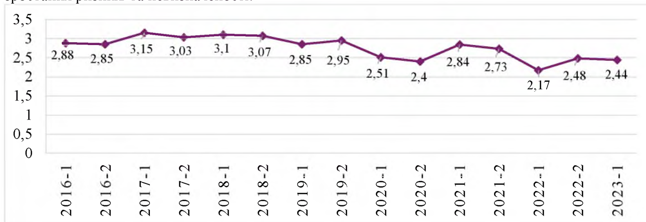
Рис. 2. Динаміка індексу інвестиційної привабливості за півріччями

Російської Федерації проти України в 2022 році індекс інвестиційної привабливості зазнав суттєвого зниження – до 2,17 бала. Це найнижчий показник з 2013 року, коли в умовах Революції Гідності він становив 1,8 бала. Збройний конфлікт справив негативний вплив на всі ключові сектори економіки, включно з інвестиційною сферою, яка виявилася особливо чутливою до зростання ризиків та невизначеності.