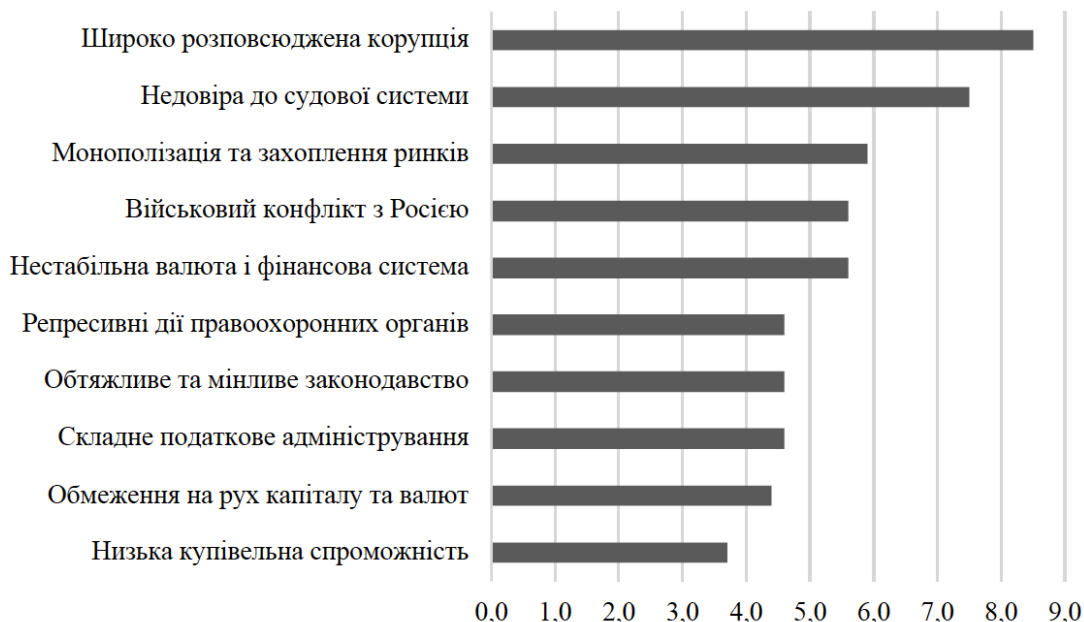
Рисунок 1. Оцінка перешкод до інвестування в Україну за рівнем їх вагомості