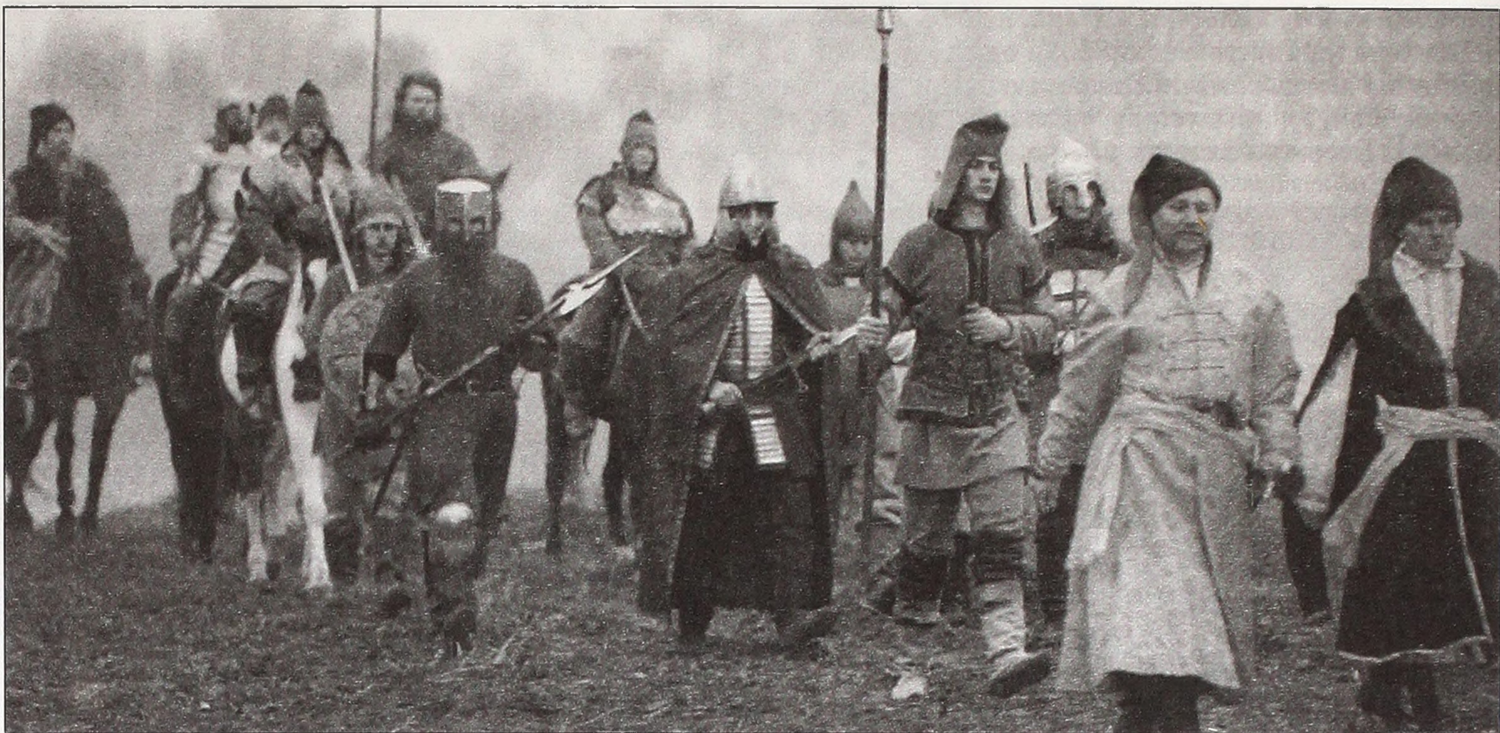
■ Кадр з фільму «Братство».