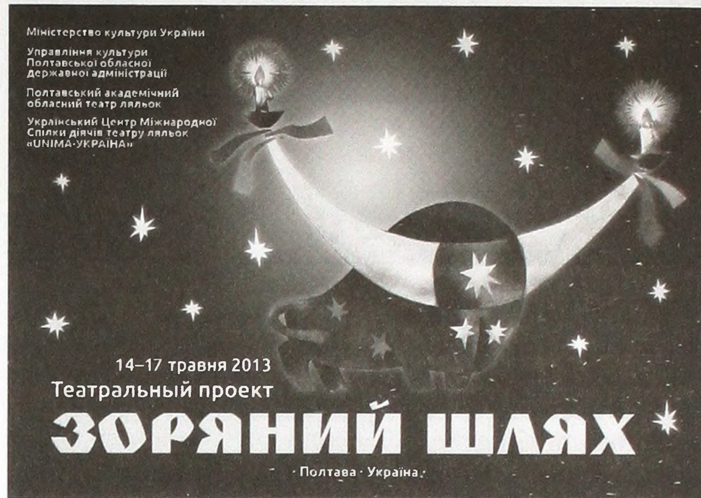
Емблема фестивалю «Зоряний шлях»

Яскравий приклад новаторського театру — Львівський академічний духовний театр «Воскресіння». Пізнього вечора 14 травня на Театральній площі Полтави львівські митці запалили вогні свого «Вишневого саду» — вистави, яку вже побачили в 45 країнах світу. Режисер-постановник, директор театру «Воскресіння» Ярослав Федоришин говорить: «Ми єдиний театр, який здійснив вуличну постановку за твором Чехова. Чехова знають за класичними постановками, і тому те, що робимо ми, вражає глядача. У Європі вуличні театри надзвичайно популярні, особливо у Франції, Чехії. Там театри навіть мають свої заводи для виготовлення реквізиту, великих декорацій. Ми раді, що публіка, яка зібралася на «Зоряному шляху», глибоко сприйняла наш «Вишневий сад»...»