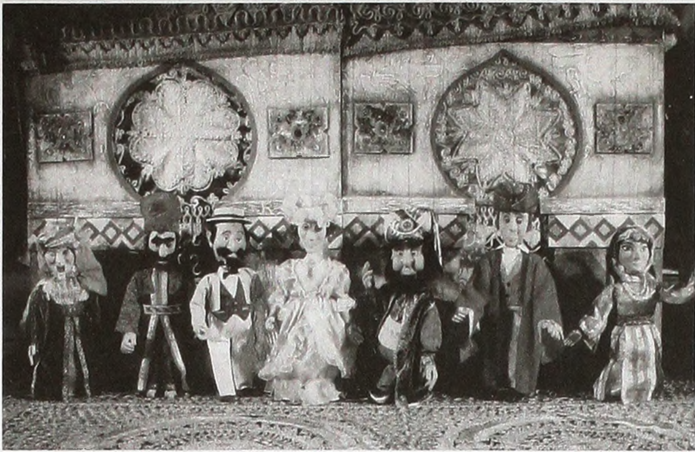
Сцена з вистави «Італійка в Алжирі» за оперою Джоаккіно Россіні. Театр «Карапет». Єреван, Вірменія.