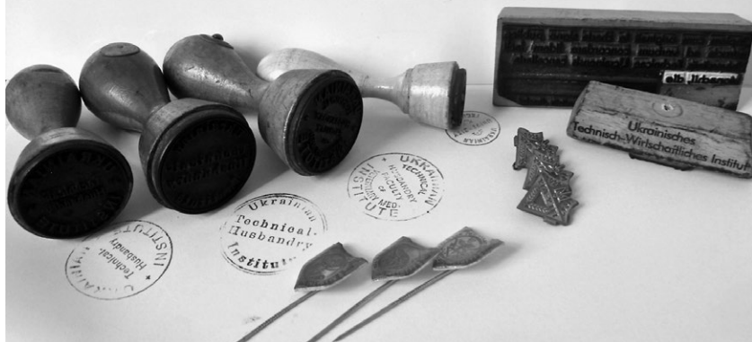
Рис. 2. Музейні предмети в складі архіву: печатки, нагрудні значки УТГІ

праці написані й опубліковані німецькою, англійською, французькою, чеською, голландською мовами. Науково-творчі матеріали представляють і соціогуманітарні (мовознавство, літературознавство, історія, право, економіка), і природничі (хімія, ветеринарія, лісівництво, фармакологія, медицина, кібернетика тощо) науки. Якщо праця вийшла у світ та вдалося віднайти вихідні дані опублікованого варіанту, то для полегшення подальшої науково-дослідної роботи в описі подано відповідну інформацію. Другу групу документів Опису № 2 складають особові справи та особисті документи окремих співробітників УТГІ. Вони включають Curriculum Vitae, атестати про закінчення середньої освіти, дипломи вищих навчальних закладів, дипломи докторів наук, посвідчення особи різних установ, списки наукових праць, рецензії на окремі праці, анкети, заяви про прийняття на роботу та звільнення, некрологи, пам'ятні статті та промови тощо. В окрему справу сформовані копії дипломів почесних докторів (honoris causa) УТГІ, якими інститут вшановував внесок викладачів, науковців, діячів церкви у розвиток інституту та української освіти. Серед них є імена відомих українських діячів (вчений Зенон Кузеля, архієпископ Іван Бучко), а також співробітників УГА та УТГІ (професори Євген