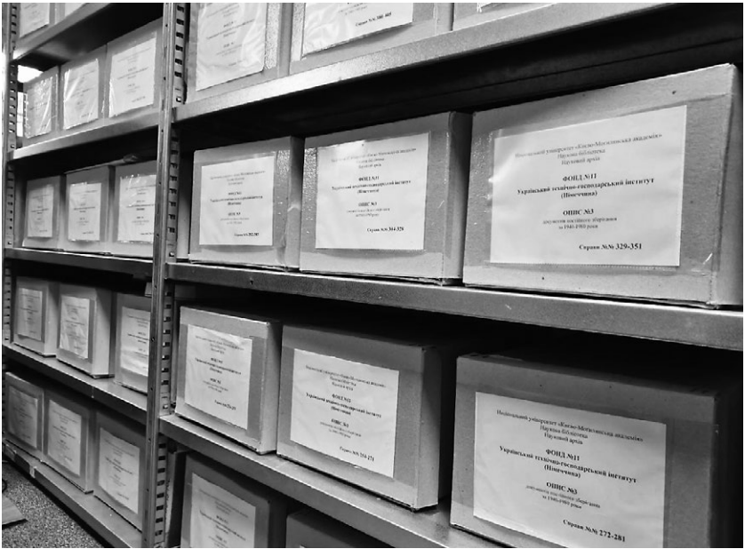
Рис. 3. Фрагмент стелажів з архівом УТГІ, який загалом нараховує 965 справ у 46 коробах.

УТГІ на території США та Канади. Але була потреба видавати не лише інформацію наукового характеру. Керівні органи інституту прагнули забезпечити прозорість і доступність інформації про всі напрями роботи. Значна частина розпорядчих, організаційних документів, що відклалися в архіві, а також фрагменти листування були опубліковані за часів діяльності інституту у вісниках, що видавалися мімеографічним (цикльостильовим) способом на правах рукопису. Наприклад протягом 1949–1958 рр. вийшло 16 випусків «Вісті УТГІ: орган внутрішньої інформації професури, абсолювентів і студентів», де публікувалися звернення ректора, річні звіти, інформації щодо стану поліграфічного розповсюдження лекцій, анонси про події, інформації про діяльність організацій в структурі УТГІ, спогади про УГА, репортажі про проведені заходи, книжкові огляди та рецензії. 11