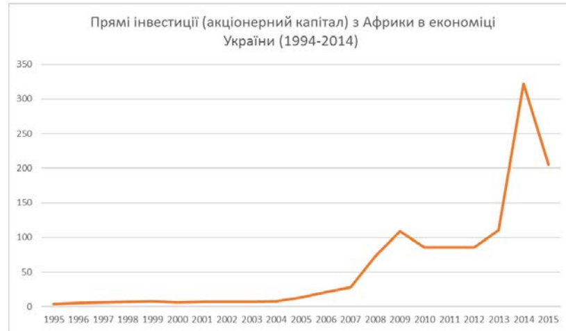
Інвестиції з країн Африки до України 16

Ще одна сфера економічного співробітництва – інвестиції. Африканські країни інвестують до України, натомість Україна поки не використовує свій інвестиційний потенціал у цьому регіоні.