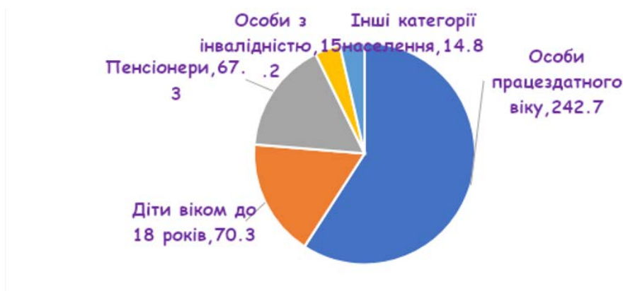
Графік 2. Кількість внутрішньо переміщених осіб у розрізі категорій, тис. осіб, 2023 р.

напрямку працевлаштування. 113 Отже, жіночі громадські організації м. Києва ґрунтуючись на вище перелічених факторах пріоритизують відповідні програмні напрямки власної діяльності.