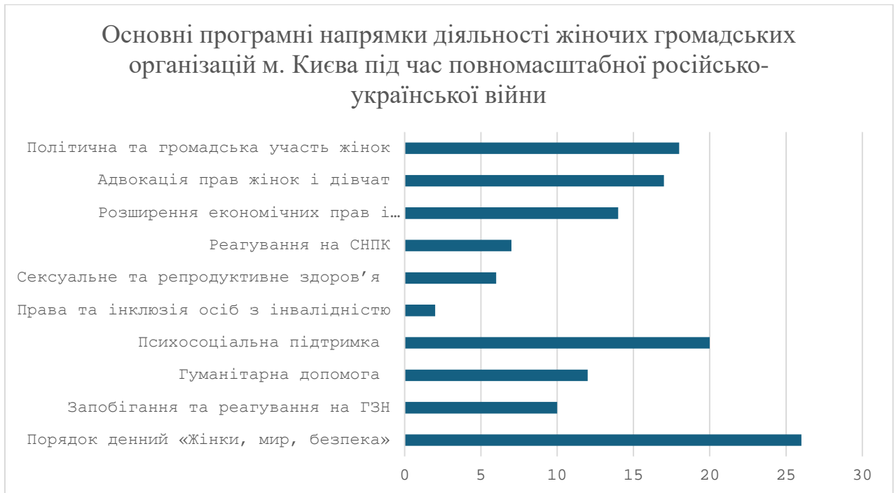
Графік 1. Основні програмні напрямки діяльності жіночих громадських організацій м. Києва під час повномасштабної російсько-української війни., узагальнено авторкою на основі контент-аналізу звітів про діяльність, публікацій на вебсайтах і сторінках на соціальних платформах жіночих громадських організацій м. Києва

Результати проведеного дослідження напрямків діяльності жіночих ГО у м. Києві демонструють, що найбільш поширеним наразі програмним напрямком діяльності є Порядок денний «Жінки, мир, безпека». Такий напрямок міститься у діяльності переважної більшості жіночих громадських організацій – 26 організацій з 30. Порядок денний «Жінки, мир, безпека» в контексті програмного напрямку визначається організацією ООН Жінки як дії, спрямовані на підтримку представництва жінок та повномірної їхньої участі в процесах миробудування. До цього поняття зокрема відноситься: запобігання конфліктам та захист прав жінок під час їхньої тривалості, орієнтованість на закриття особливих потреб жінок у контексті конфлікту, а також залучення жінок у процеси постконфліктного відновлення. 106 Таким чином цей напрямок має достатньо широкий програмний характер – до нього входить спектр послуг, які стосуються реалізації прав жінок в умовах збройного конфлікту.