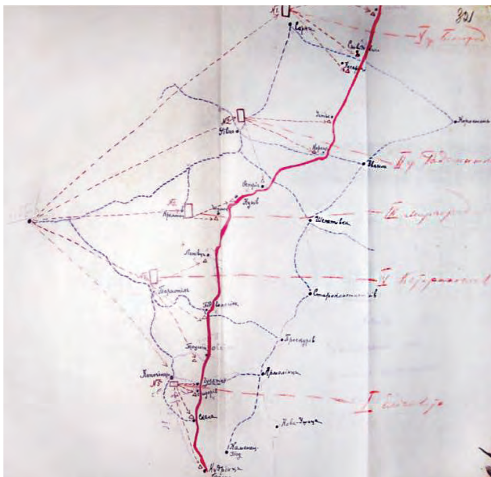
Рис. 145. Схема переходу українських розвідників через польсько-радянський кордон, 1921 р.