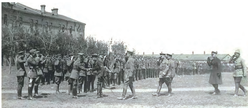
Рис. 142. Вручення прапора 6-й стрілецькій дивізії Армії УНР Головним Отаманом Симоном Петлюрою. Бердичів, 5 травня 1920 р.