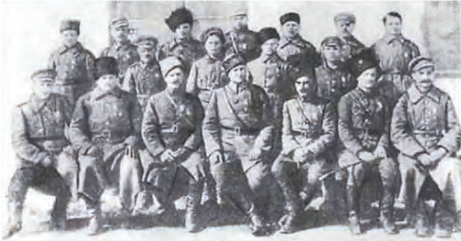
Рис. 143. Група учасників Другого зимового походу разом із інтернованими солдатами. Місто Каліш (Польща), осінь 1921 р.

роззброїли прикордонну охорону і здобули 32 коней і 12 підвід, на які склали зброю, підривні матеріали, медикаменти і скарбницю. Далі Волинська група вирушила у напрямку Коростеня (рис. 145). 6–7 листопада повстанці оволоділи залізничним вокзалом цього міста, захопили склад зброї та звільнили з в'язниці 470 селян, які не виконали продподаток; розстріляли чекістів і розігнали радянську міліцію. Проте на допомогу комуністам прибуло два бронепотяги і 1000 курсантів Школи червоних старшин, що змусило українців відступити.