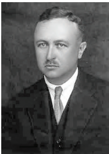
Рис. 138. Тадеуш Кшижановський (1889–1954 рр.)

Протистояння з поляками тривало не лише у військовій площині. Так, наприкінці 1918 р. на терени Волині поширює діяльність польська організація громадсько-політичного характеру «Кресова сторожа», яка була утворена в лютому того ж року в м. Любліні. Ця структура реалізовувала на практиці політичну програму Юзефа Пілсудського щодо східних земель, а окремі її волинські представники брали участь у діяльності організації ще від її заснування 191 . Від започаткування діяльності на Волині й до підпорядкування регіону польськими військами в середині 1919 р. «Кресова сторожа» не розгорнула в краї активної роботи, функціонуючи здебільшого підпільно, формуючи позитивний образ Польщі й готуючи підґрунтя для польської адміністрації. Тактика діяльності цієї структури на Волині відбита в інструкції для керівника «Кресової сторожі» регіону Генрика Орловського, де зазначалося: «У контактах із місцевим населенням початково слід уникати висунення ідеї незалежної України. В розмовах з інтелігенцією варто наголошувати на зацікавленості Польщі в появі незалежної України. У питанні незалежної України потрібно розмежовувати Волинську й Галицьку Русь від Русі Київської. Центром Української держави повинен стати Київ» 192 . Одним зі знаних діячів «Кресової сторожі» на Волині був згадуваний вище Т. Кшижановський 193 (рис. 138).