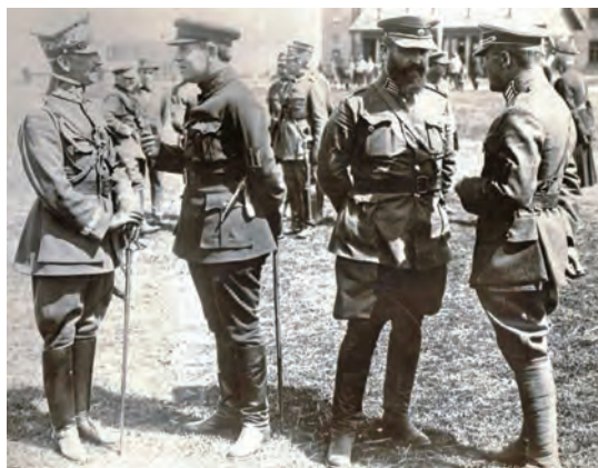
Рис. 141. Польський генерал Антоній Лістовський, Головний Отаман Симон Петлюра, полковники Володимир Сальський і Марко Безручко. Бердичів, 21 квітня 1920 р.

між Австро-Угорщиною та Росією до Вижгородка, а від Вижгородка на північ до Кременецьких гір, а потім по лінії на схід від Здолбунова, вздовж східних адміністративних кордонів Рівненського повіту, а далі на північ вздовж кордону колишньої губернії Мінської до перетину його р. Прип'ять, а потім Прип'яттю до її гирла» з приміткою, що майбутній статус Рівненського, Дубенського та частини Кременецького повітів визначатиметься додатково. За три дні, 24 квітня, підписано Військову конвенцію, яка окреслювала спільну польсько-українську протибільшовицьку військову акцію. Обидві угоди були таємними, за винятком пункту 1 політичної конвенції 204 (рис. 141, 142).