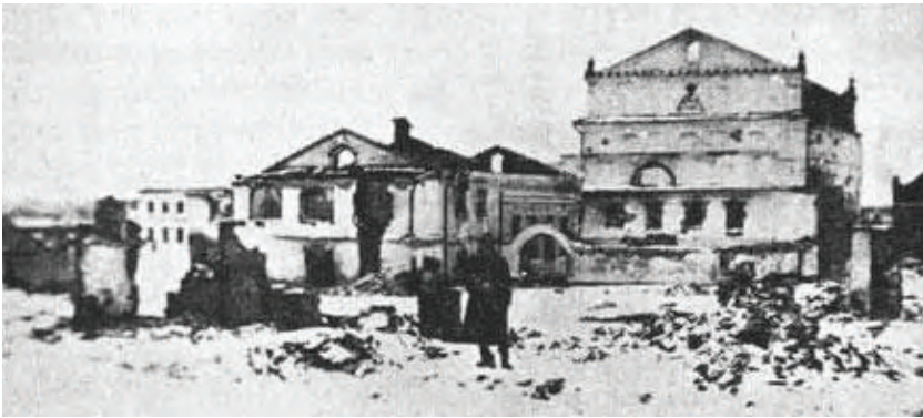
Рис. 137. Новоград-Волинський після погрому та пожежі 1919 р.

Із Житомира погромники перейшли до Троянова. 11 січня в містечко прибули підводи з сімома озброєними козаками та трьома жінками, які почали грабувати будинки євреїв. Єврейська громада не могла протистояти погромникам, адже останні володіли зброєю. В цій ситуації на захист євреїв стали місцеві православні селяни-українці. Вони убили одного погромника, дві нападниці утекли, а решту вдалося затримати. Селянський схід ухвалив рішення покарати злочинців смертною карою 183 .