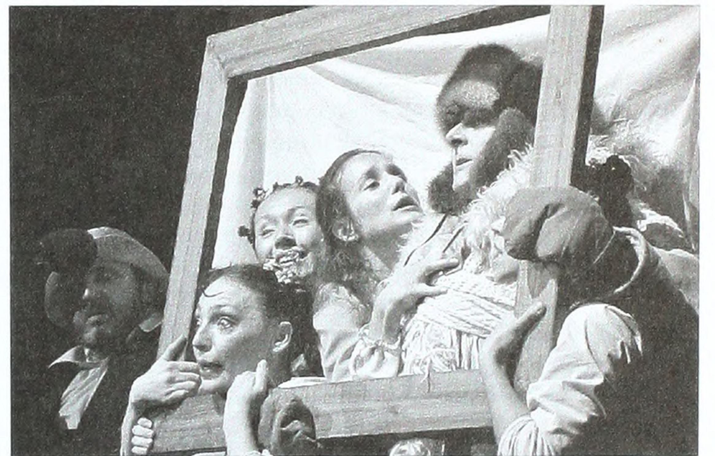
Сцена з вистави «Вірочка». Російський драматичний театр ім. О. С. Пушкіна, Якутськ.