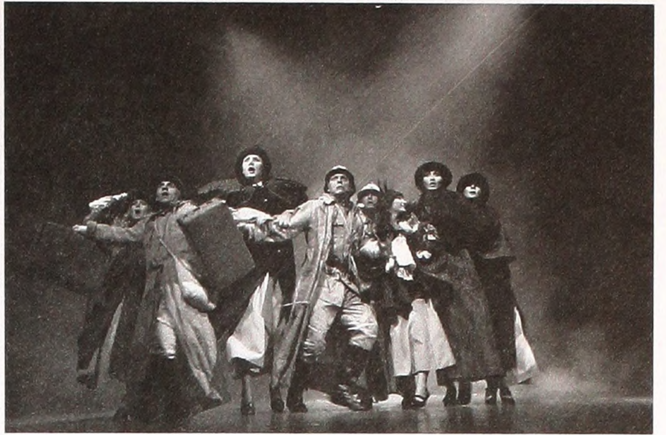
Сцена з вистави «Прощай, зброє». Криворізький театр музично-пластичних мистецтв «Академія руху».