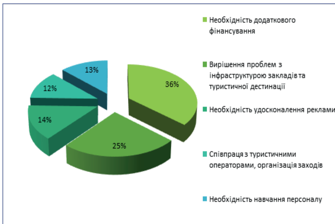
Рис. 2 – Шляхи вирішення проблем розвитку об'єктів історико-культурної спадщини (у відсотках відповідей респондентів)