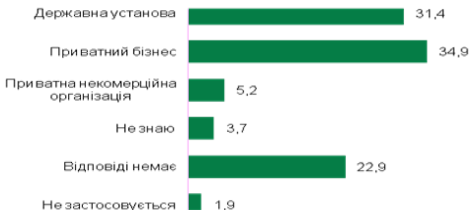
Рис. 8.3. Рід занять (професія) населення України

Утім, попри високий рівень освіченості населення, лише 34,9% опитаних українців задіяні в приватному секторі економіки, рис.8.3. (порівняно, наприклад, із Туреччиною (62,5%), Сінгапуром (70,2%), Португалією (70,8%)).