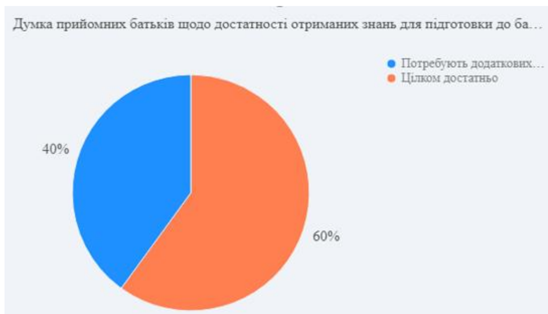
Рис. 3.2.1 Діаграма результатів відповідей респондентів щодо достатності знань, отриманих за програмою підвищення батьківського потенціалу

Це демонструє важливість спеціалізованого навчання та розвитку для всіх прийомних батьків, включаючи психологічну підготовку та підтримку.