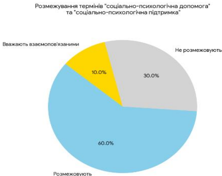
Рис. 3.1.1 Діаграма розподілу відповідей щодо розмежування термінів «соціально-психологічна допомога» та «соціально-психологічна підтримка» серед працівників соціальних служб

«Можна дати яблуко і допомогти людині подолати голод, а підтримка – це коли давай помиєм, поріжемо, почистим» (респондент б).