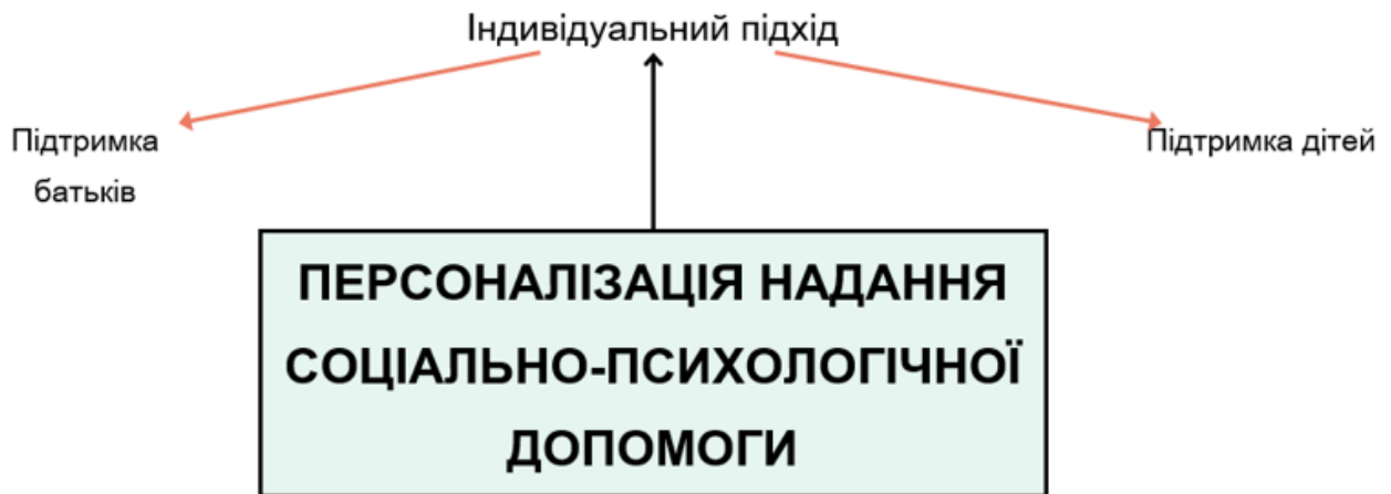
Рис. 4.3.1 Тематична мережа «Складові персоналізованої соціально-психологічної допомоги»

важливим для створення сприятливого сімейного клімату. Не менш важливо, щоб батьки знали, як піклуватися про власне психічне здоров'я, звертатися за допомогою у разі потреби та підтримувати один одного, адже їхній власний психологічний стан безпосередньо впливає на благополуччя дитини.