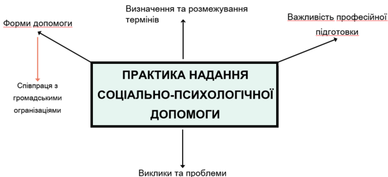
Рис. 4.1.1 Тематична мережа «Зміст соціально-психологічної допомоги дітям-сиротам та дітям, позбавленим батьківського піклування»

У ході дослідження, проведеного з використанням методології ключових тематичних мереж, було виявлено особливість надання соціально-психологічної допомоги дітям-сиротам та дітям, п/б/п. Зокрема, встановлено, що Служба у справах дітей переважно здійснює моніторинг процесу забезпечення прав та інтересів цих дітей, тоді як безпосереднє надання соціально-психологічної допомоги здійснюється фахівцями соціальної сфери, які проходять спеціалізоване навчання перед початком роботи, а особи, які беруть на себе функції батьківського піклування щодо таких дітей, отримують не лише початкове навчання, а й систематично підвищують свою кваліфікацію.