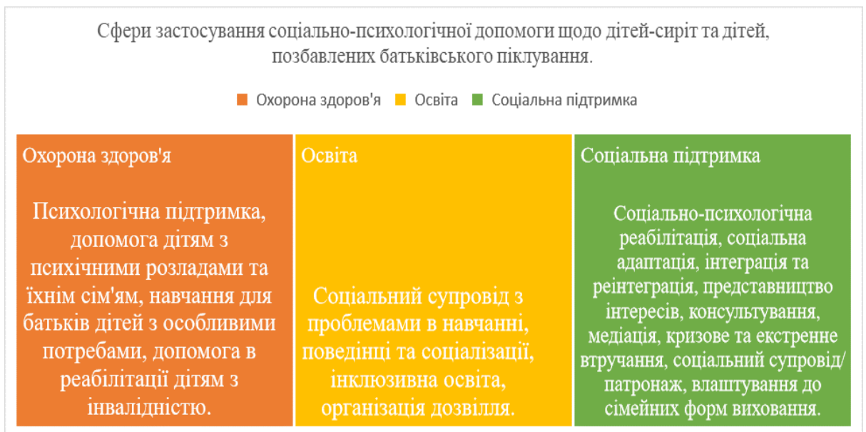
Рис. 3.1.2 Сфери застосування соціально-психологічної допомоги сім'ям, що виховують дітей-сиріт та дітей, позбавлених батьківського піклування

Таким чином, соціально-психологічна допомога виступає невід'ємним елементом комплексної підтримки дітей-сиріт та дітей, позбавлених батьківського піклування, охоплюючи як безпосередню роботу з дитиною, так і взаємодію з її найближчим оточенням.