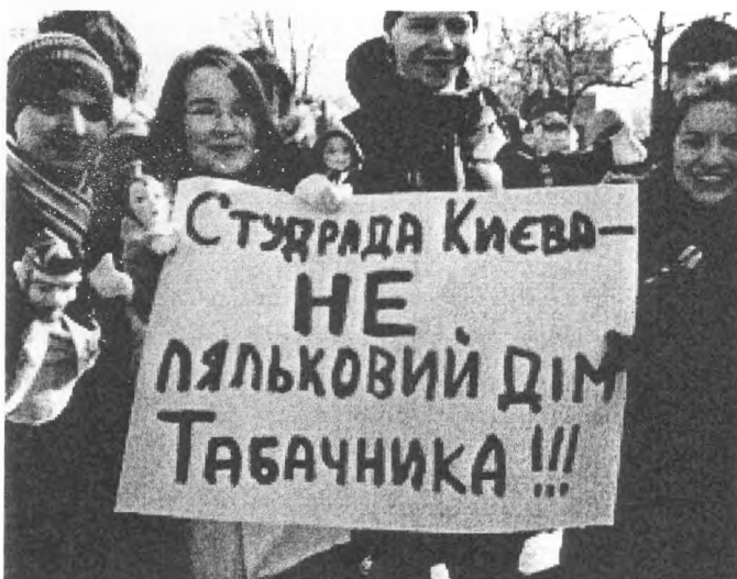
Фото з акції проти тиску Міністерства освіти і науки на студентське самоврядування 6. 03.13