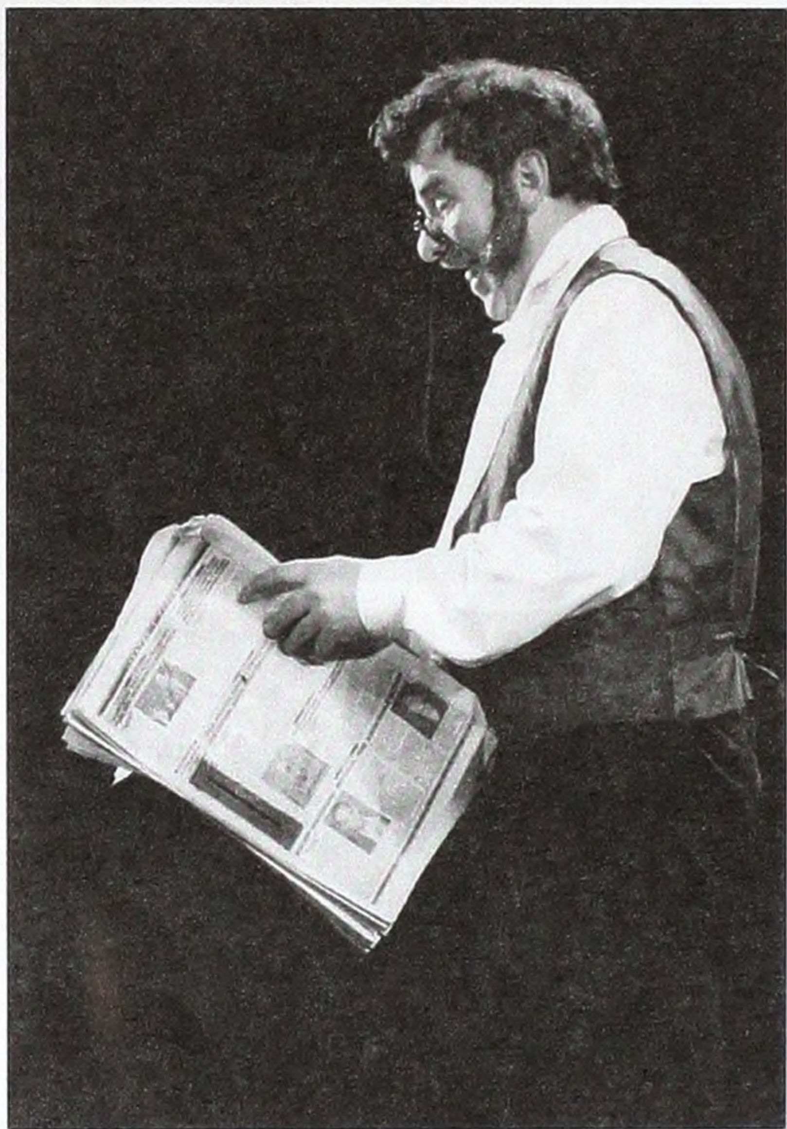
Володимир Коляда у виставі «Шельменко-Денщик» за Г.Квіткою-Основ'яненком.

прагнуть динамізму. Це в основному старше покоління, яке сприймає швидше емоцію, ніж дію. Дуже приємно, що театр сьогодні популярний серед молоді. Наприклад, ми граємо «Приборкання норавливої» Шекспіра. І хоча тексту вже декілька століть, молоді він зрозумілий і близький. І нас це, звичайно, тішить. Театр – це велика сила впливу на душі. Часті аншлаги – свідчення того, що театр потрібний. Я іноді сам не можу взяти квитки для своїх друзів.