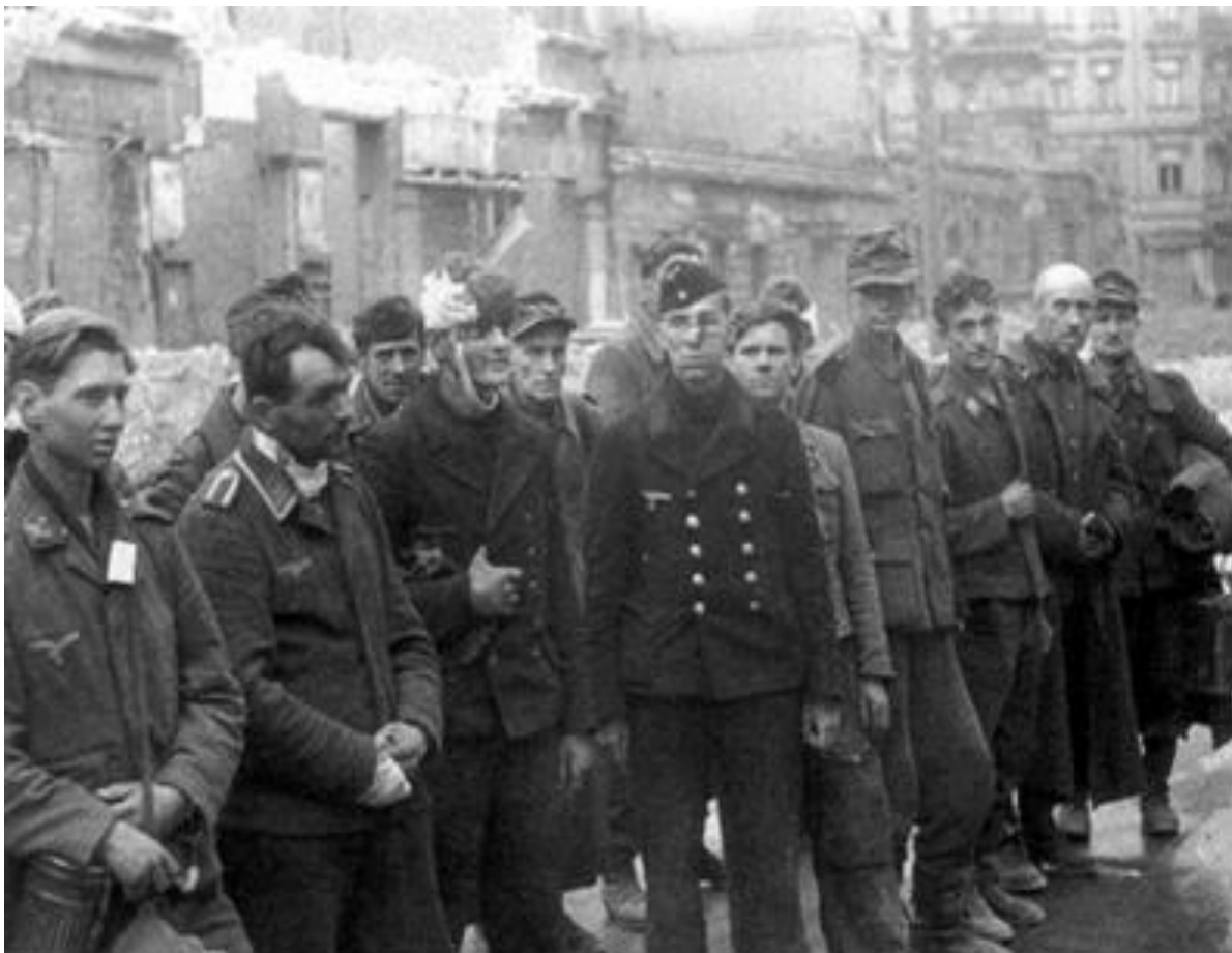
Німецькі військовополонені після битви за Берлін.