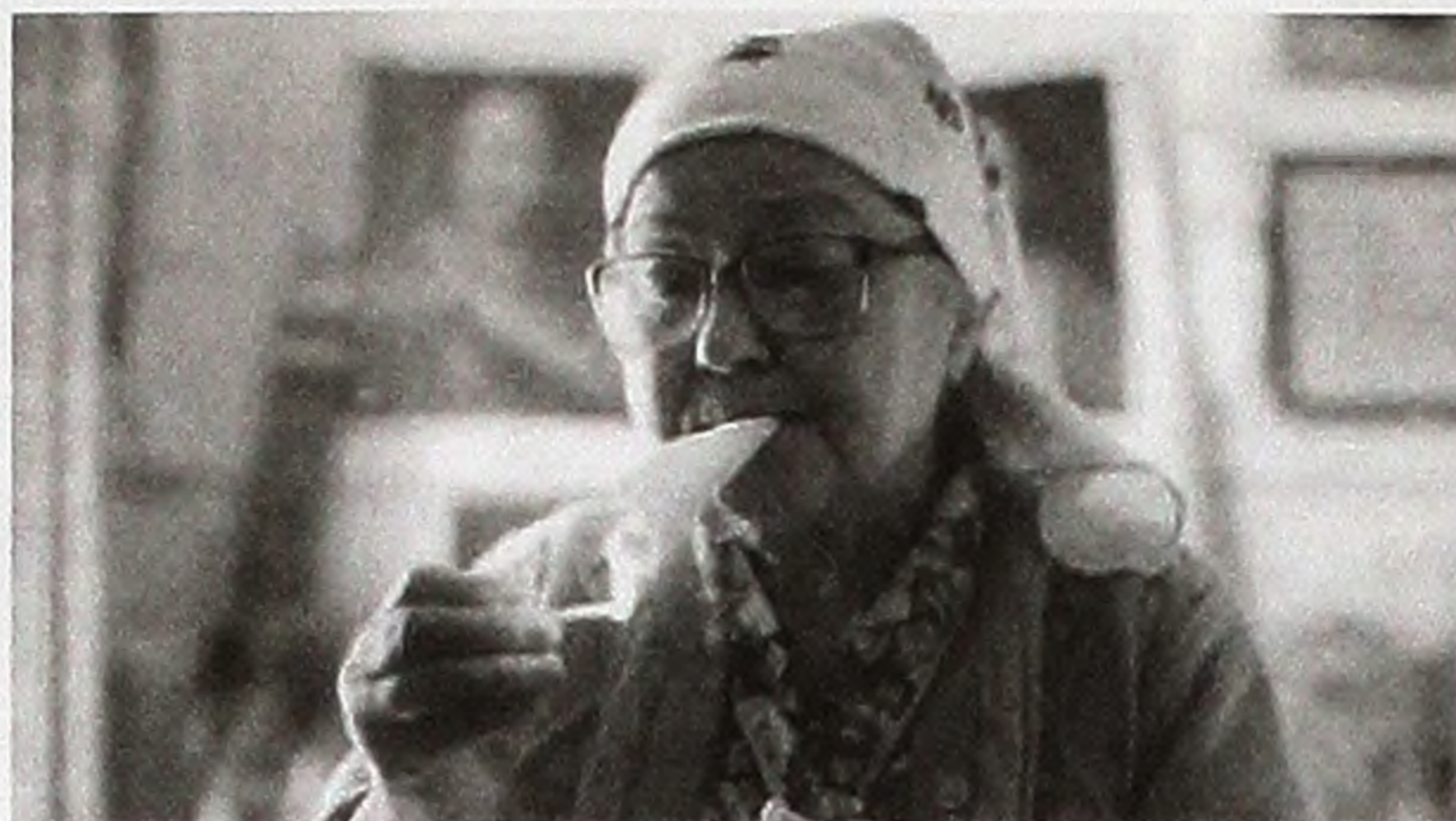
Кадр з фільму «Пиріг», режисер Юрій Ковальов.