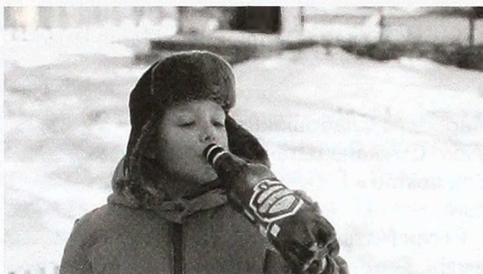
Кадр з фільму «Як козаки у космос полетіли», режисер Євген Матвієнко.