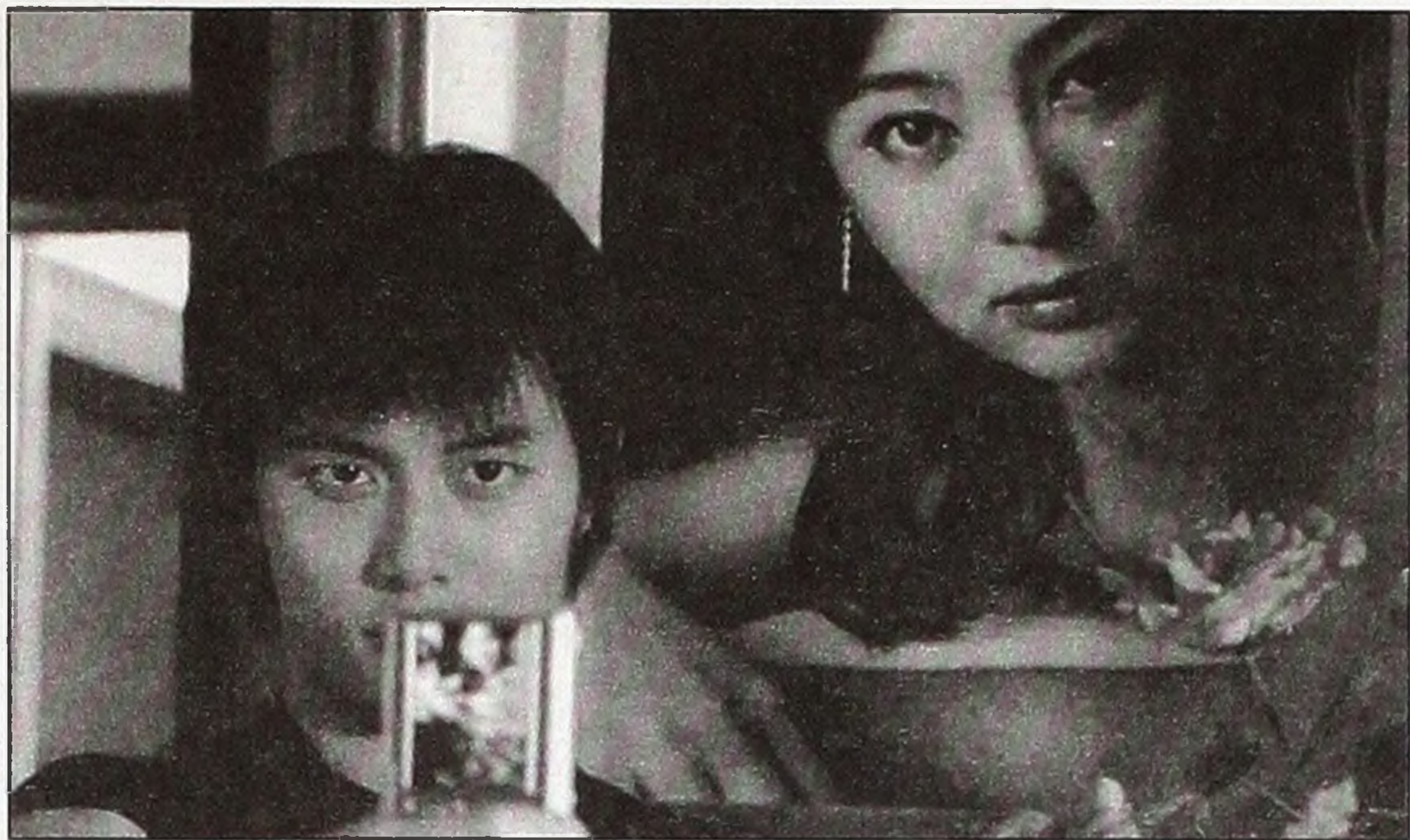
■ Кадр з фільму «Порожній будинок». Режисер Кім Кі-дук. Південна Корея.