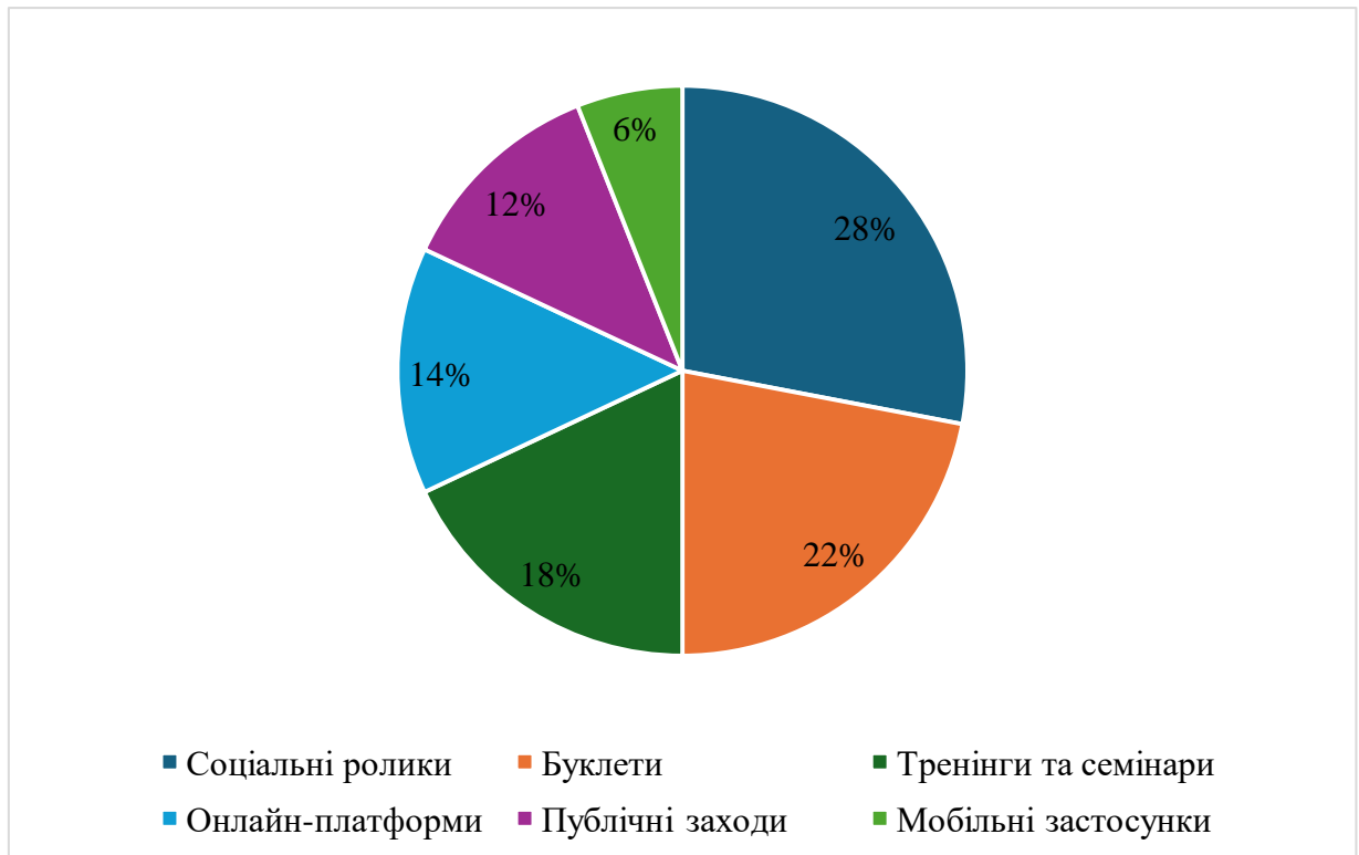
Рисунок 3.3 Результати аналізу форм профілактичної активності щодо протидії торгівлею людьми в Україні під час війни

Рисунок ілюструє результати аналізу форм профілактичної активності у сфері протидії торгівлі людьми. Найпоширенішим форматом є соціальні ролики (28%), що свідчить про орієнтацію на візуальний контент і широке охоплення аудиторії. На другому місці – буклети (22%), які залишаються традиційним інструментом інформування. Водночас значну частку займають тренінги та семінари (18%), що вказує на активне використання інтерактивних методів просвіти. Онлайн-платформи становлять 14%, публічні заходи – 12%, а мобільні застосунки – лише 6%. Така структура демонструє, що попри зростання цифрових технологій, перевага все ще надається класичним та аудіовізуальним форматам, тоді як інноваційні мобільні інструменти залишаються малопоширеними. Це вказує на потенціал для подальшого розвитку цифрових форм профілактики.