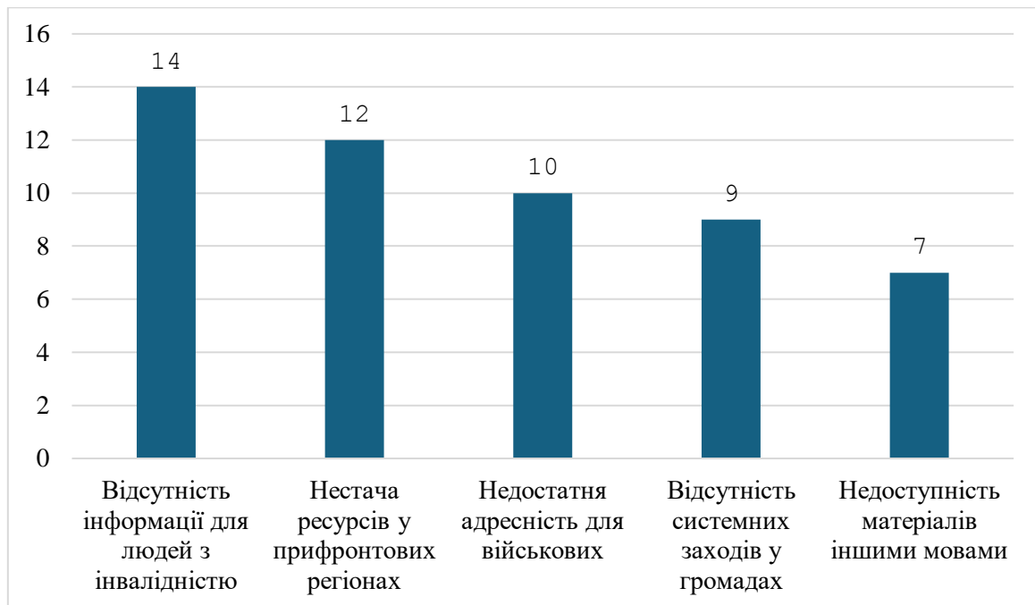
Рисунок 3.4 Виявлені прогалини у профілактичній роботі за типами

Заключним етапом дослідження було співвідношення виявлених прогалин за типами на основі кількості згадок у звітах і дослідженнях (див. рис.3.4)