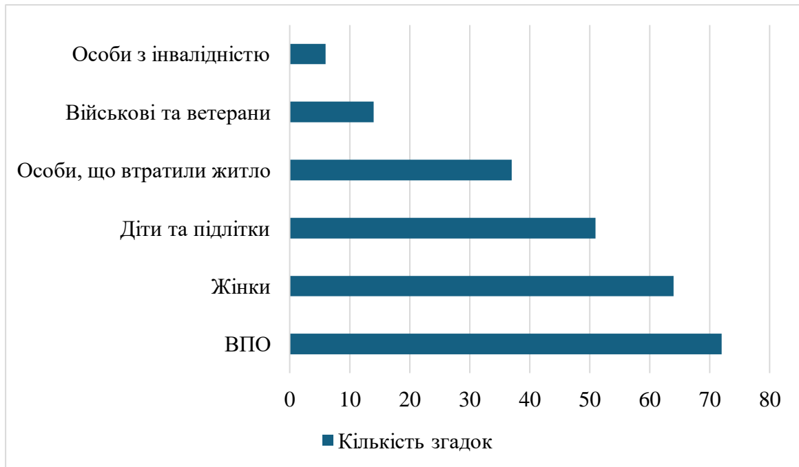
Рисунок 3.2 Результати аналізу цільових аудиторій, на які спрямовані профілактичні кампанії щодо протидії торгівлі людьми (кількість згадок у матеріалах)

Рисунок демонструє результати аналізу цільових аудиторій, на які спрямовані профілактичні кампанії з протидії торгівлі людьми, на основі кількості згадок у публікаціях за період 2022–2024 років. Найчастіше згадуються внутрішньо переміщені особи – 73 рази, що свідчить про визнання їх однією з найбільш уразливих груп у контексті ризику потрапляння в ситуацію торгівлі людьми. Значна увага також приділяється жінкам (65 згадок), дітям і підліткам (52) та особам, які втратили житло (38). Натомість військові, ветерани та особи з інвалідністю отримують значно менше уваги в інформаційних матеріалах – лише 15 та 6 згадок відповідно. Такий розподіл свідчить про пріоритетність окремих груп у профілактичній роботі, а також вказує на потенційні прогалини в охопленні менш видимих, але не менш уразливих категорій населення.