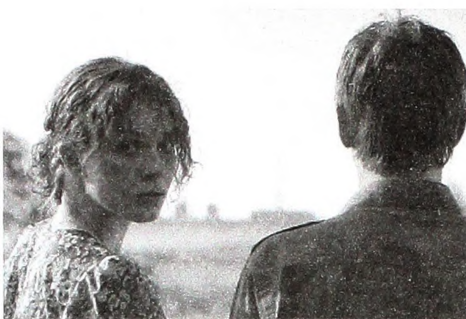
«В суботу». Режисер Олександр Міндадзе. Росія, Німеччина, Україна, 2011.