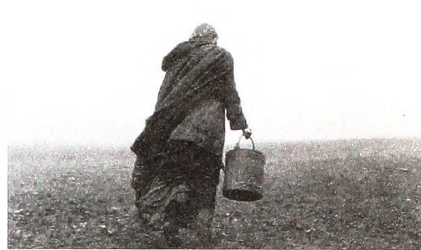
«Туринський кінь». Режисер Бела Тарр. США, Німеччина, Франція, Швейцарія, Угорщина, 2011.

Стрічка іранського режисера Асхара Фараді «Надер і Ясмін, розлучення» дістала майже всі престижні нагороди «Берлінале»: «Золотого ведмеда», два «Срібних» – за кращу жіночу і чоловічу роль (отримали ансамблем всі актори і акторки), приз Екуменічного журі, газети «Моргенпост». Йдеться про житейську і соціальну драму. Дружина намовляє чоловіка покинути Іран. Спочатку він згоден, але потім не хоче залишити хворого батька. Дружина кидає чоловіка. Їхня донька залишається з батьком... На думку кінокритиків, фільм добротний, але в оцінці спрацювали симпатія і співчуття до іранських кіномитців, які працюють у непростих умовах.