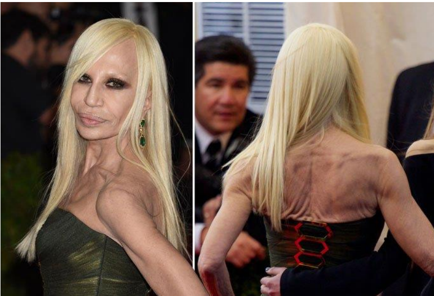
Донателла Версаче (італ. Donatella Versace; 2 травня 1955)