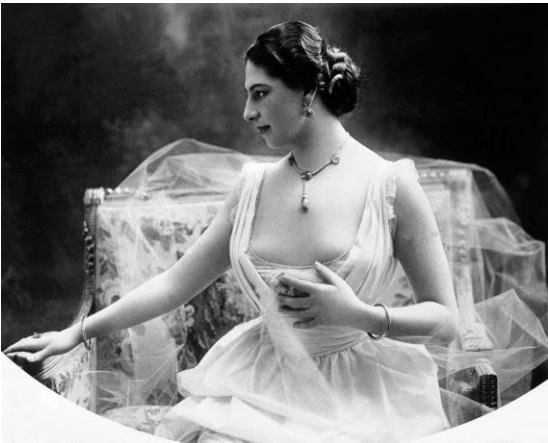
Мата Харі (нід. Margaretha Geertruida Zelle)