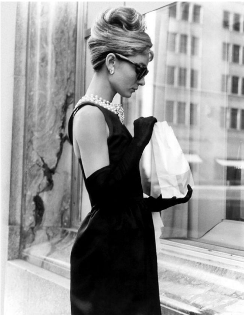
Одрі Хепберн (англ. Audrey Hepburn 4 травня 1929 — 20 січня 1993)