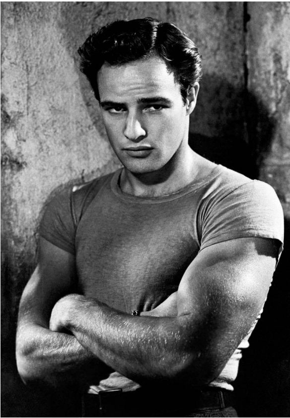
Марлон Брандо (англ. Marlon Brando; 3 квітня 1924 — 1 липня 2004)