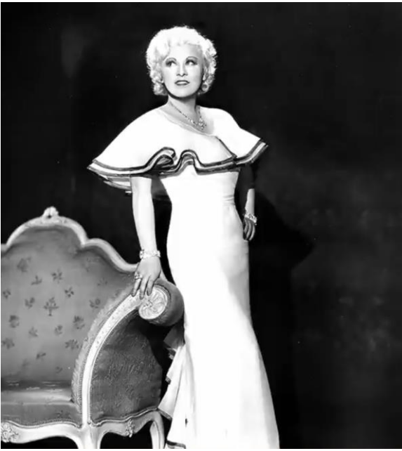
Мей Вест (англ. Mae West, 17 серпня 1893 — 22 листопада 1980)