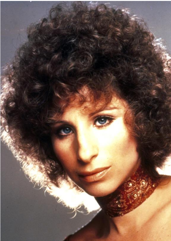
Барбра Стрейзанд (англ. Barbra Joan Streisand; 24 квітня 1942).