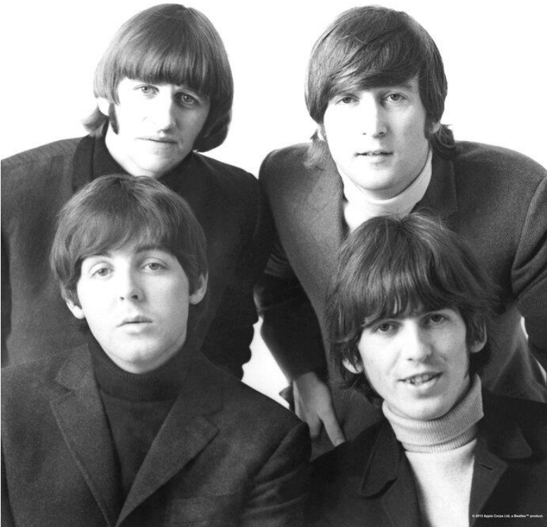
Учасники групи «Beatles»