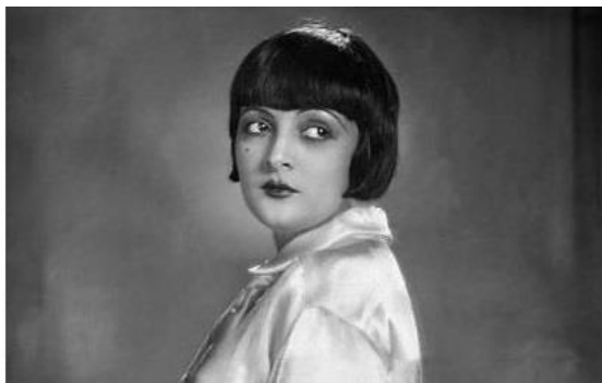
Лія де Путті (англ. Lya De Putti; 10 січня 1897 — 27 листопада 1931)