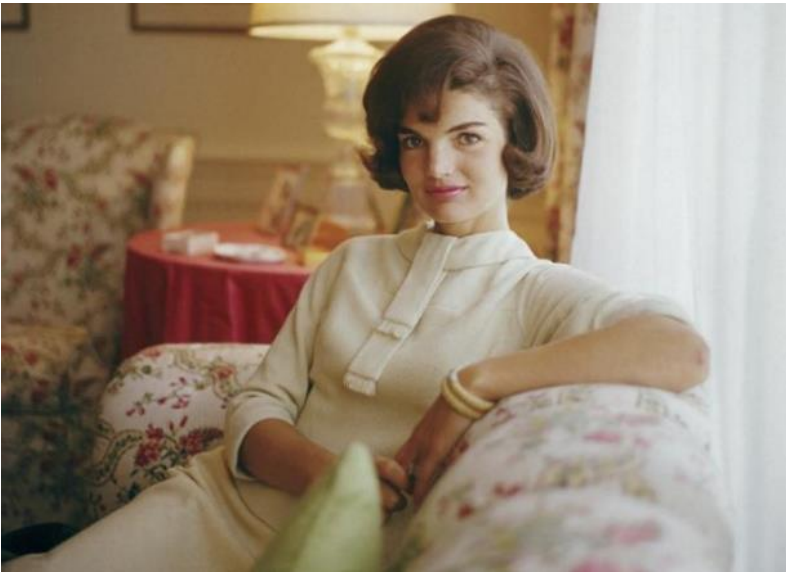
Жаклін Лі Був'є Кеннеді Онассіс (англ. Jacqueline Lee Bouvier Kennedy Onassis; 28 липня 1929 — 19 травня 1994)