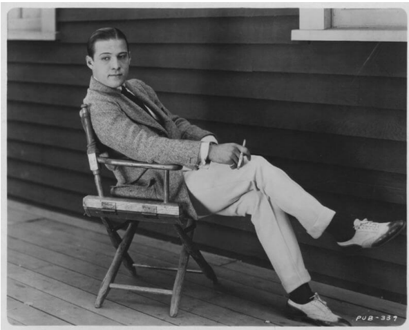
Рудольф Валентино (англ. Rudolph Valentino; 6 травня 1895 — 23 серпня 1926)