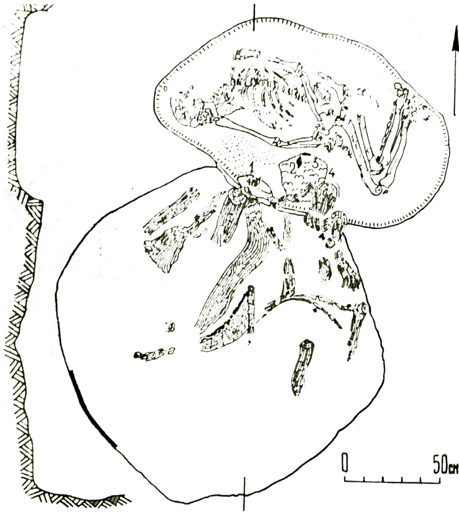
Рис. 1. Поранення сокирою (м. Привілля Луганської області, курган 1, поховання 7)

було здійснено стрілами, адже останні зазвичай не виймали з тіла, й вони чудово збереглись.