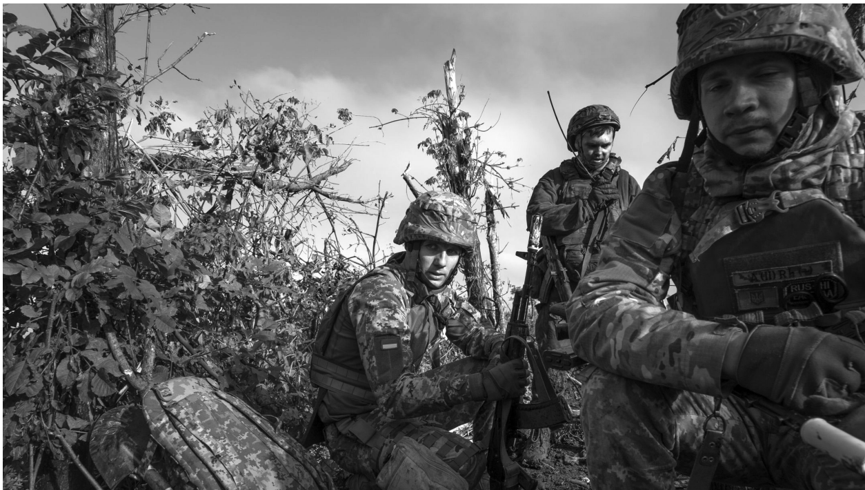
Кадр з фільму «2000 метрів до Андріївки».

щось страшенно важке, остаточне й однозначне – і думати стало нікому, нічого, нічим і ні до чого». А на «нулі» така перспектива постійно. Діалоги, що точаться під час бою, ошелешують: «Що з тобою, братан?» – «Я – все!» – «Жодних все, знімай броню, понесемо!» Доповідає: «В мене "300-й", перебиті всі кінцівки, взагалі в нас багато "300-х"!» – «Повзи – Мороз, Лисий повзуть – і ти зможеш! Рухайся, живи!» – «Лишусь тут...» – «Не здумай тільки підірвати себе – я вернусь». «Хто там горить? Треба б витягти...» «Пустий!» – «Я теж». «Тримаймось, не відходимо!»