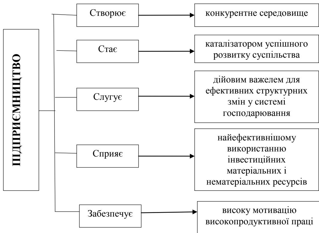
Рис. 1 – Роль підприємництва у формуванні ефективної системи господарювання

Багаторічний досвід усіх без винятку індустріально розвинутих країн з ринковою економікою соціального спрямування незаперечно підтверджує, що підприємництво – необхідна умова досягнення економічного зростання.