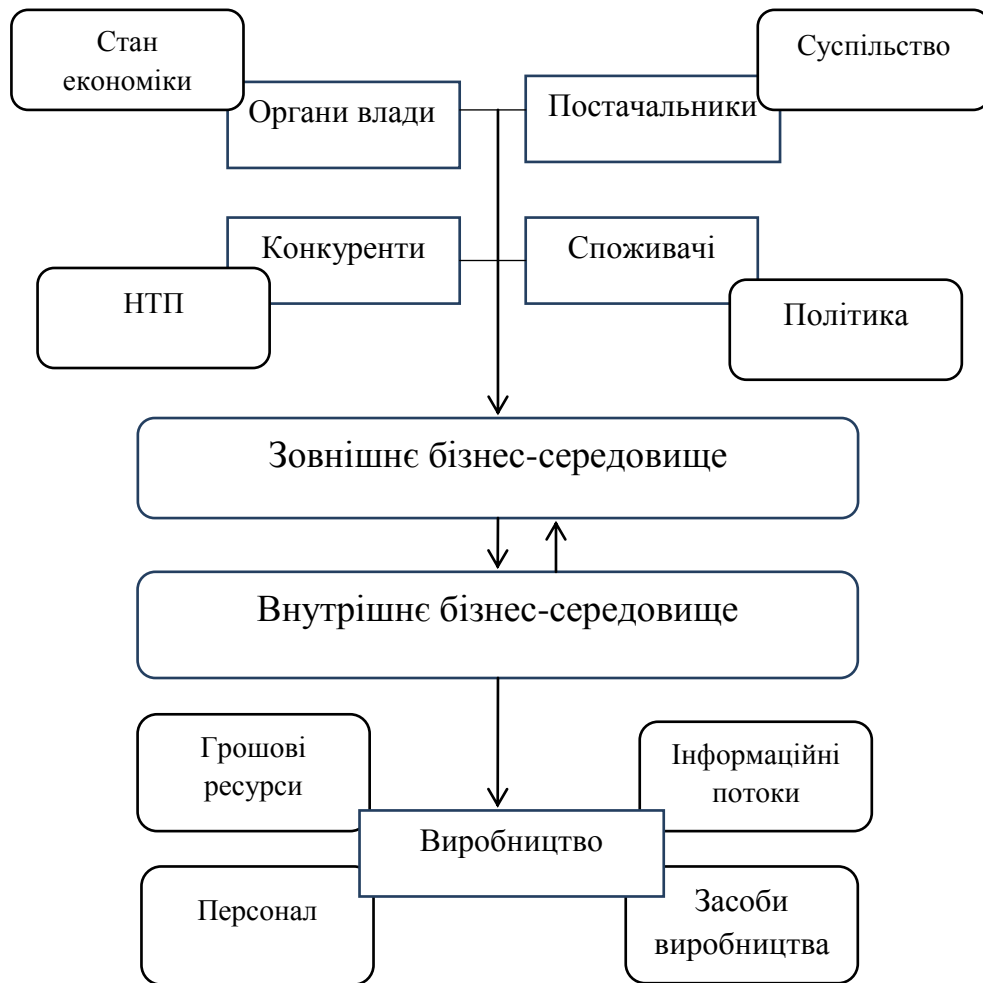
Рис. 3 – Складові бізнес-середовища