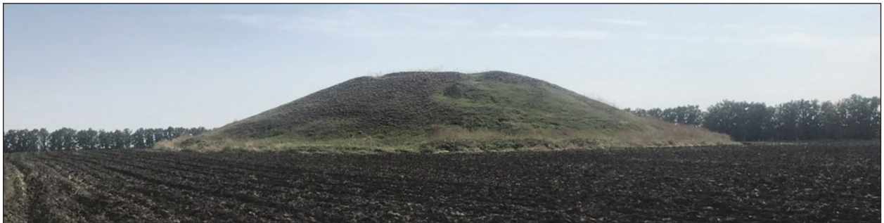
Рис. 1. Курган Юрицина Могила, вигляд до пограбування, фото літа 2020 р.

Безбоязне триразове втручання сучасних грабіжників до насипу кургану та його підземної частини, до глибини 6 м, пояснюється тим, що суд Казанківського р-ну, не маючи достатніх підстав (?), двічі без покарання відпустив екскаватор та бульдозер, які поліція затримувала на місці злочину. З приводу цієї