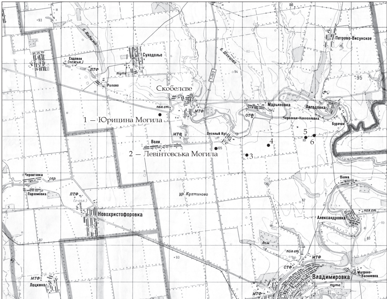
Рис. 3. Схема розташування великих курганів вздовж правого берега р. Вісунь поблизу с. Скобелеве

масштабної та безпрецедентної події Спілка археологів України направила лист-звернення до президента України. А всенациональні та регіональні засоби масової інформації вже протягом двох місяців тримають цю подію в центрі уваги.