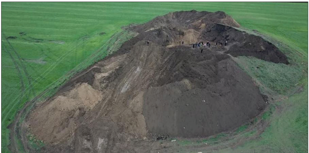
Рис. 2. Курган Юрицина Могила, вигляд після трьох циклів роботи техніки грабіжників, фото з дрону І. Зелінського 11 листопада 2020 р.