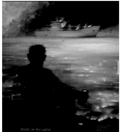
Владислав Шерешевський. Дим на воді. 2022. Полотно, олія