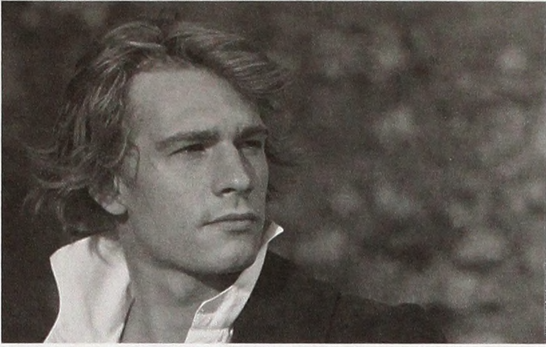
Гійом Депардьє у фільмі «Всі ранки світу» («Tous les matins du monde»). Режисер Ален Корно. Франція, 1991.

marchands de sable») 2000-го. Втім, комічне амплуа, хоча й принесло найбільше визнання акторові, все ж не стало головним для нього. Може, це й суб'єктивне сприйняття, та здається, що значно виразнішими та багатшими на нюанси є його драматичні ролі. Найвдаліші з його персонажів – майже завжди маргінали, страшенно чутливі люди, інколи також приховані ідеалісти, які несуть у собі незбагненний смуток світу й незрозумілий оточенню біль. Та, може, таке амплуа пасує акторові ще й тому, що й сам Гійом був таким трохи неприкаяним романтиком, назовні шорстким, але насправді дуже беззахисним (про його глибоку інтровертність, що напозір так суперечить його публічній поведінці, говорять чи не всі колеги та друзі). До того ж, біль для актора був далеко не абстрактним поняттям. Після фатальної аварії на мотоциклі 1995 року (з даху автівки, що їхала попереду, на дорогу впала валіза), Гійому зробили сімнадцять операцій на колінній чашечці, та 2003 року лікарям довелося ампутувати йому ногу. Крім того, ще під час першої операції в лікарні йому внесли складну інфекцію, що остаточно зруйнувала надію на повне одужання. Тож можна тільки уявити, як сприймає світ людина, що роками (!) відчуває нестерпний фізичний біль. Біль, який часом не зникав навіть після прийому морфію.