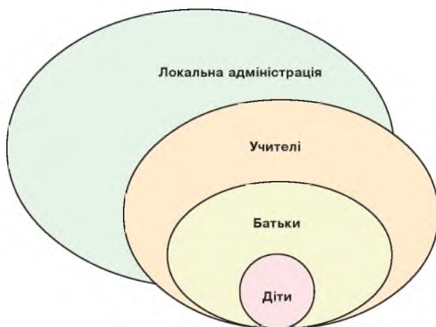
Рис. 7. Структура організованої допомоги дітям через дорослих

Відповідно до ступеня переживання постраждали діти потребують різного типу допомоги, яка може бути надана спеціалістами різного профілю. Передусім діти можуть отримати психосоціальну підтримку в навчальних закладах системи освіти, тому що для них це звичне середовище, де вони проводять багато часу. Психосоціальна підтримка — це комплексна різноманітна допомога в умовах кризи, спрямована на активацію ресурсів, підвищення особистої компетенції та формування нових навичок подолання стресу. Психосоціальна допомога — це допомога, яка базується на здоровій частині людини та спрямована на посилення ролі громади, а також навчального закладу [3, 4].