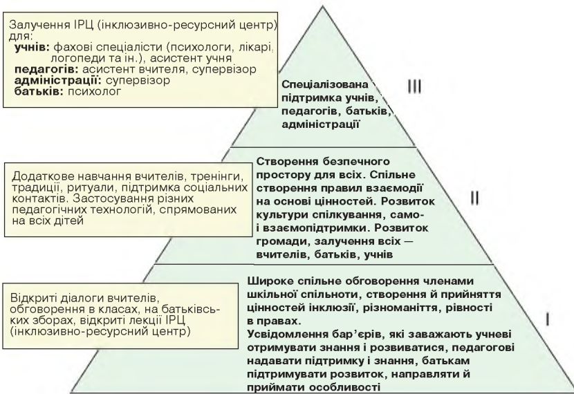
Рис. 5. Розбудова безпечного простору в інклюзивній освіті