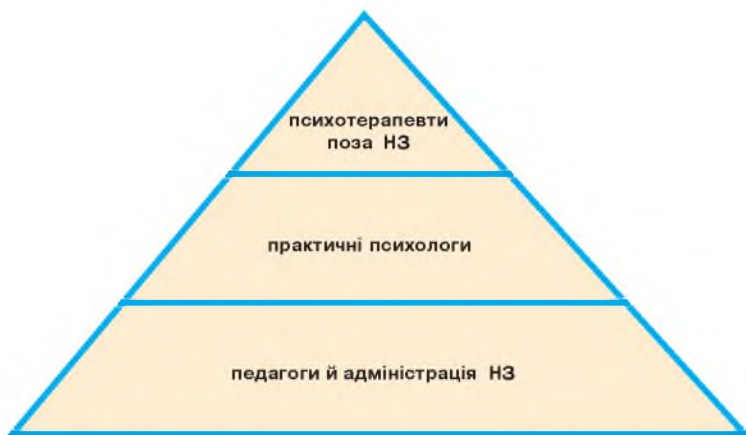
Рис. 2. Комплексна модель психосоціальної допомоги

ми. Психосоціальна допомога учням передбачає створення сприятливих для розвитку резилієнс дитини умов як у навчальному класі зокрема, так і в навчальному закладі загалом, що уможлиблює розв'язок емоційних проблем дітей, налагодження безконфліктного спілкування з однолітками, сприяє розвитку в учнів про-соціальної поведінки.