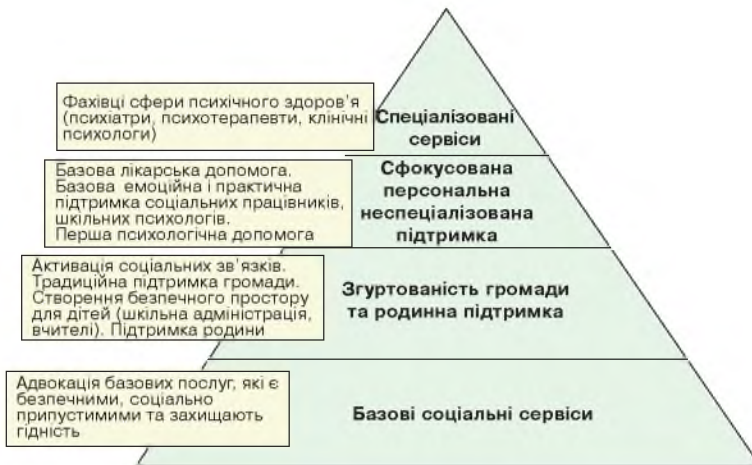
Рис. 8. Рівні надання соціальної, педагогічної, психологічної допомоги постраждалим (Mike Wessells, 2014)

про конфіденційність, турбуватися щодо емоційного здоров'я дитини та включати додаткові ігрові методи в процес навчання загалом для всіх дітей, щоб уникати стигматизації учнів та створювати безпечний простір розвитку для кожного.