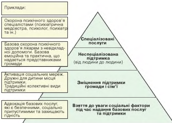
Рис. 3. Піраміда інтервенцій у системі психосоціальної підтримки в надзвичайних ситуаціях

На першому рівні надається допомога та підтримка, що відповідає базовим потребам — їжа, житло, матеріальна допомога, медичне обслуговування — та потреби в безпеці. На цьому рівні працюють спеціальні соціальні та гуманітарні організації і служби, відповідальні саме за надання базової допомоги. Навчальних закладів та школи це стосується тією мірою, якою життя дитини в школі пов'язане із задоволенням базових фізичних потреб дітей