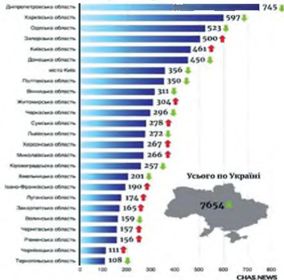
Рис. 6. Статистичні дані щодо скоєння самогубств в Україні по областях [13]

Де в Україні скоїли найбільше самогубств у 2020 році