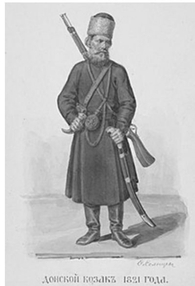
ДОНСКОЙ КОЗАКЪ 1821 ГОДА.

URL: http://www.bizslovo.org/content/index.php/ru/koz-tvo/51-odyag/94-odyag-zapor-kozakiv.html