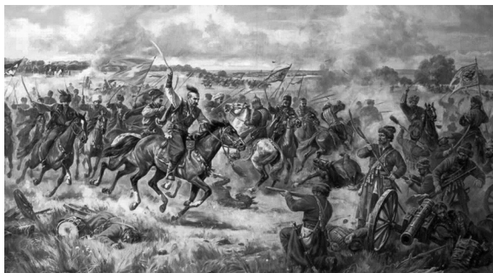
Конотопська битва 27–29 червня 1659 р. Картина Артура Орлюнова