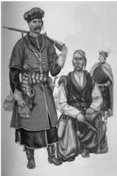
Яворницький Д. І. Одяг запорозьких козаків

URL: https://spadok.org.ua/krayeznavstvo/ukrayina-na-kartakh-richchi-zannoni