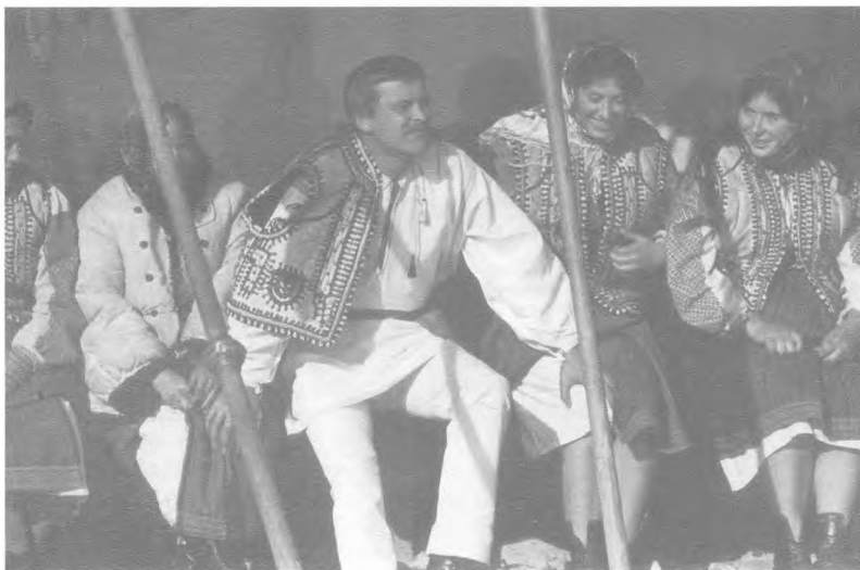
Іван Миколайчук на зйомках «Камінного хреста».

Все це вказує на неймовірну глибину творчого хисту режисера, його вміння комбінувати та перетворювати одні шедеври на інші, перевірену часом класику – на класику новітню, яка за 50 років уже посіла своє заслужене місце в пантеоні українського та світового кінематографа.