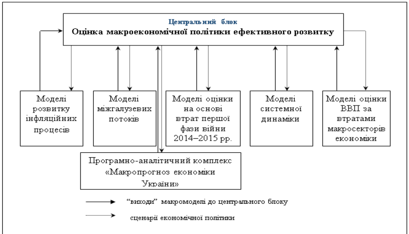
Рис. 1.3. Блок-схема модельного комплексу імітаційного макропрогнозування

інтерпретації економіко-математичного моделювання та прогнозування отримав назву «зіркова інтеграція макромоделей» (рис. 1.3).