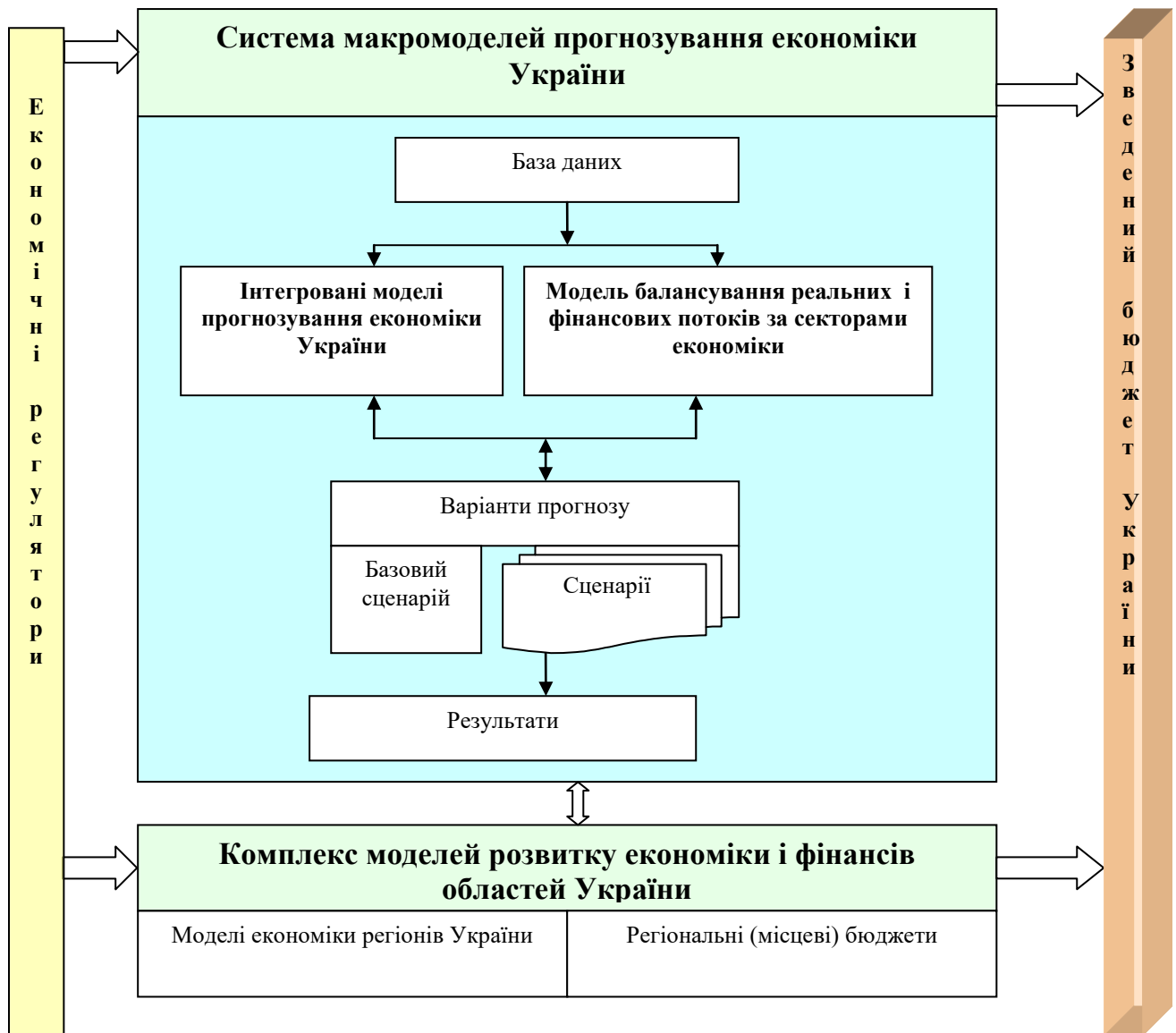
Рис. 1.4. Система макромоделей прогнозування економіки України

гічного укладу і саме зараз багато досліджень присвячено тим технологічним змінам, які становитимуть підґрунтя майбутнього розвитку.