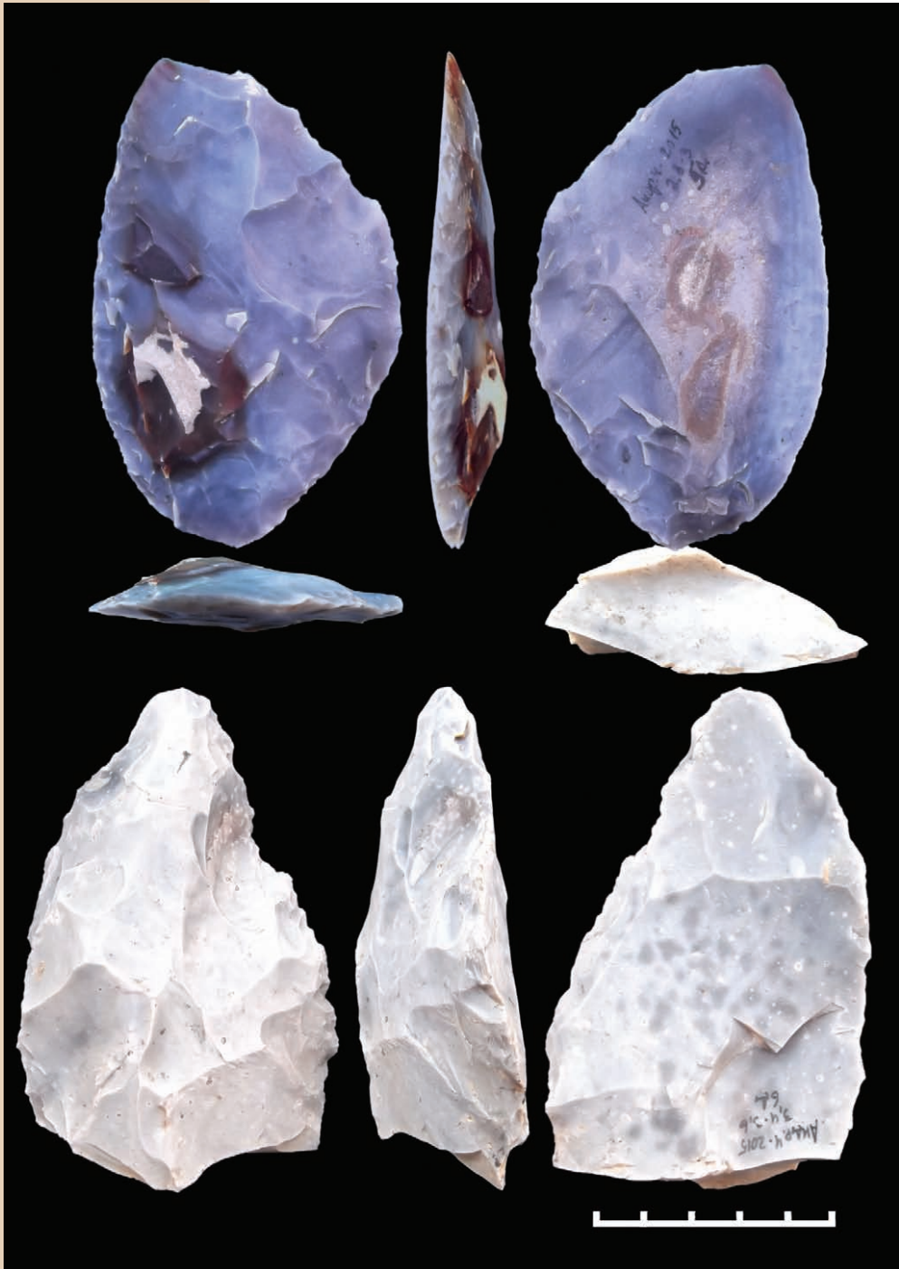
Андриївка 4, крем'яні скребла-ножі з нижнього шару