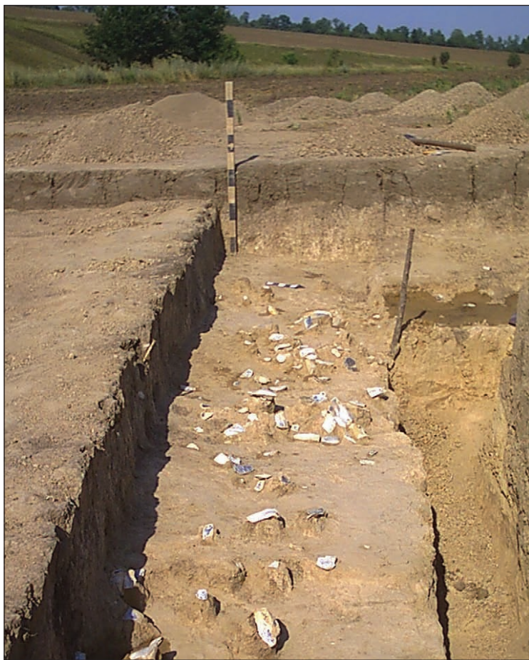
Троянове 4, культурний шар стоянки з крем'яними виробами кроманьйонців

вали неандертальці. Крем'яні вироби стоянок з околиць с. Троянове має прями паралелі в граветських матеріалах із численних стоянок Середнього та Верхнього Подністров'я. Схоже, що група граветських стоянок поблизу с. Троянове, що датуються близько 25 тис. років тому, постала внаслідок просунення граветського населення басейну Середнього Дністра на схід майже до Дніпра.