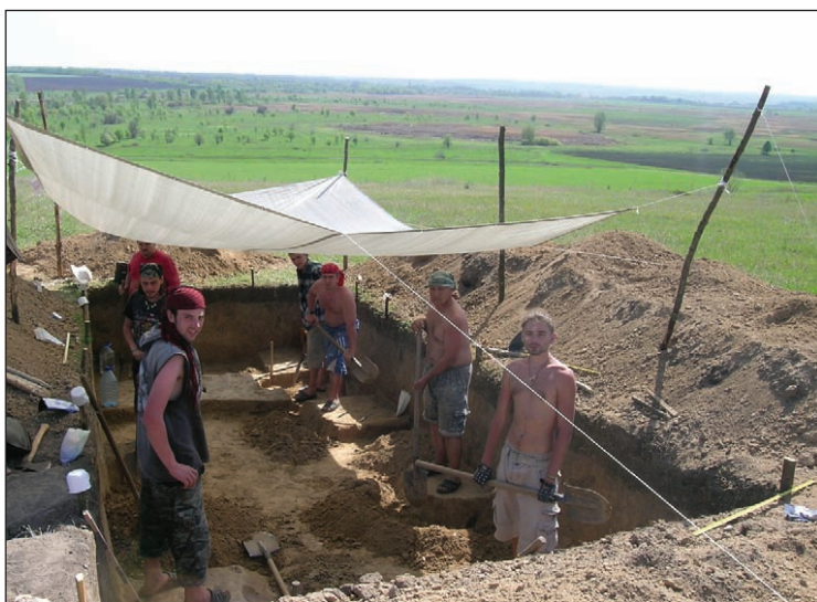
Вигляд на долину р. Велика Вись зі стоянки неандертальців Андріївка 4