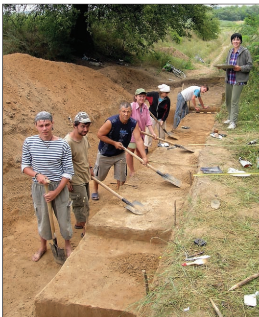
Вись, викладачі та студенти НаУКМА на розкопках стоянки