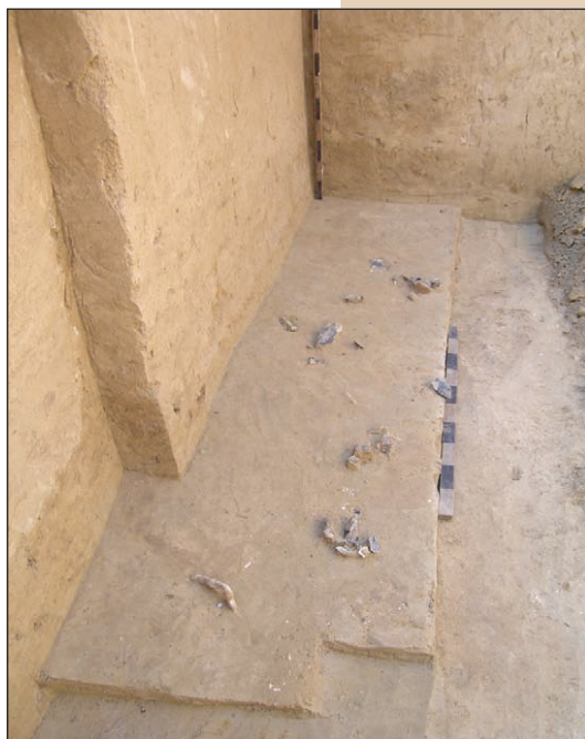
Андріївка 4, крем'яні вироби неандертальців та кістки тварин на дні яру

Після вимирання останніх неандертальців близько 28 тис. років тому почалася середня пора верхнього палеоліту, яка представлена на Висі яскравими пам'ятками гравецької культурної традиції, дослідженими поблизу села Троянове. Величезні колекції крем'яних артефактів, добытих на стоянках Троянове 4 і 4В, дають яскравий приклад крем'яних виробів гравецької культурної традиції, яка 28—19 тис. років тому поширилася від атлантичного узбережжя Європи на заході до басейну Дону на сході, тобто на територіях, де ще недавно доміну-