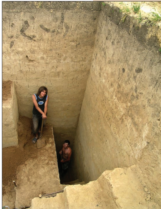
Андріївка 4, студенти НаУКМА в пошуках решток неандертальців під потужними відкладами льодовикового лесу