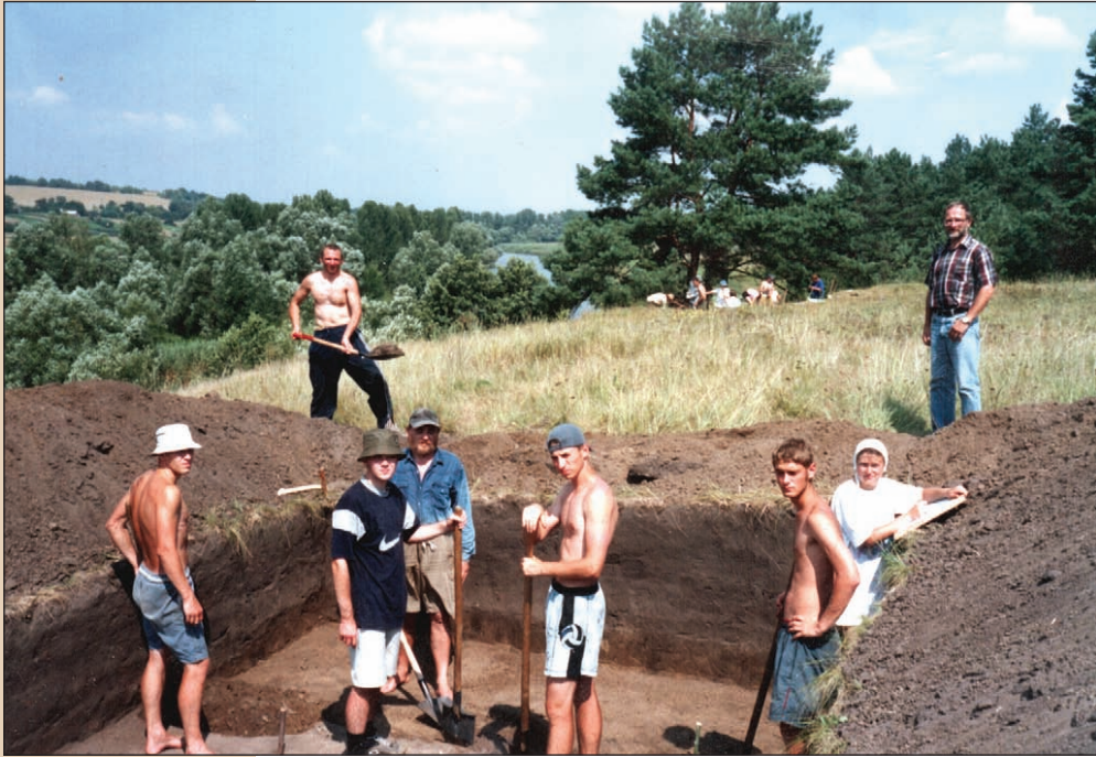
Розкопки неолітичного поселення Добрянка на р. Чорний Тікич

Криш) у другій половині VI тис. до н. е. призвів до формування найдавнішої неолітичної культури України — буго-дністровської. Нові хвилі неолітичних переселенців із Подунав'я витіснили буго-дністровців із Побужжя в північно-східному напрямку — у Черкаське та Київське Подніпров'я. Завершила процес витіснення буго-дністровців на Середній Дніпро на початку V тис. до н. е. потужна хвиля трипільських землеробів із територій Молдови.