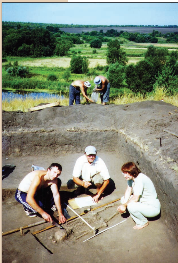
Добрянка, розчистка неолітичного поховання

манітних палеолітичних стоянок у Центральній Україні створило умови для синтезу локальних періодизацій верхнього палеоліту країни в єдину культурно-хронологічну періодизацію верхнього палеоліту усієї України.