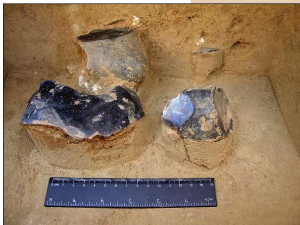
Андріївка 4, скупчення крем'яних виробів у нижньому шарі