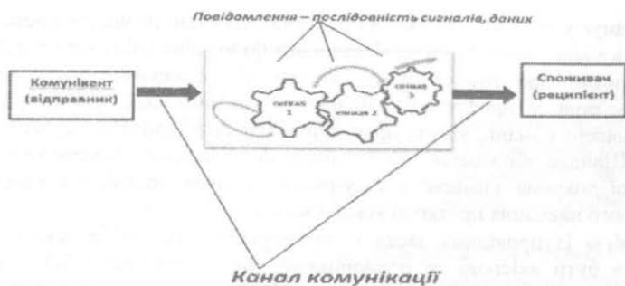
Рис.1 – Соціальний комунікаційний інформаційний процес