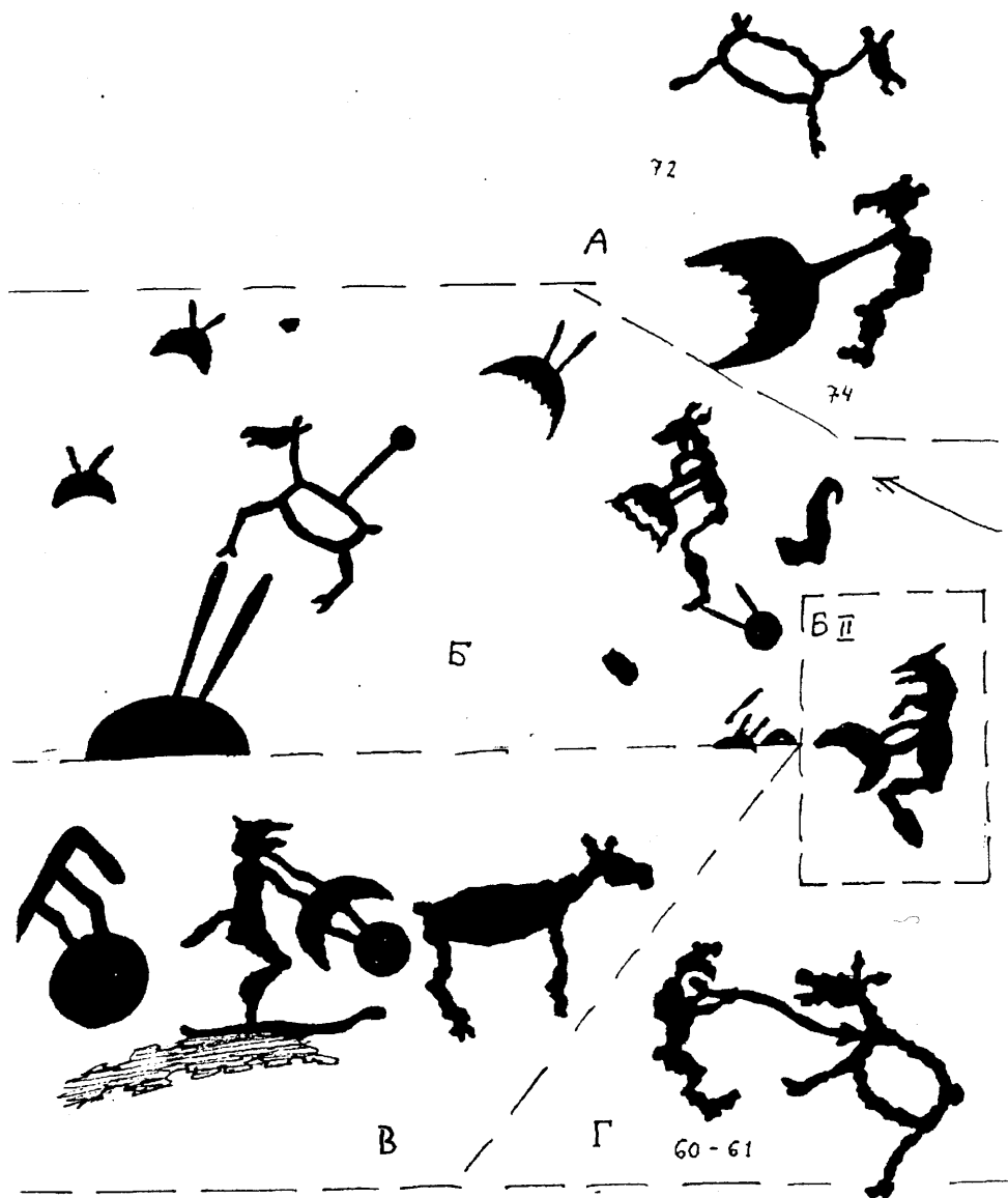
Мал. 2. Небесний олень та "Темний Володар".

герой. Він також запліднює Богиню, але це не є його основною характеристикою. Він — Володар вод земних та небесних, він "доїть" богиню, ллючи на землю її молоко — дощ. Саме тому в деяких культурах, коли в стріху потрапляє блискавка, гасити можна лише молоком. У хаті ж часто розводили домашніх змій (в Індії, у слов'ян) та годували їх молоком. Це були уособлення духів-охоронців будинку, адже Змій — передусім охоронець [13] (порівн. Едичний Йормунганд навколо землі). Йому дарували найцінніше, щоб він це зберігав. Відповідно, з'явилася асоціація, що це — бог багатства. Із ним пов'язувалась блискавка та вітер. У різних традиційних суспільствах і досі шанують змія-блискавку,