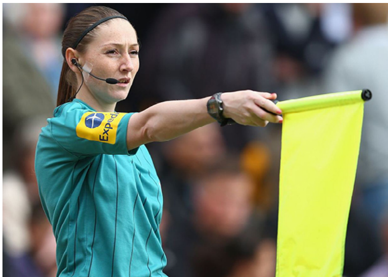
Арбітерка Сіан Массі

можливо, увагу від власних проявів гомосексуальної поведінки.