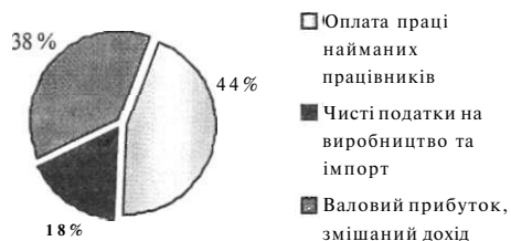
Рис. 1. Структура ВВП України за компонентами доходу, 2000 р.

Структура ВВП, визначеного методом «кінцевого використання», показує, як підприємства, домашні господарства та уряд використовують валовий внутрішній продукт на приватне споживання, інвестиції та експорт. У 2000 р. (рис. 2) лівова частка ВВП України припадала на кінцеві споживчі витрати - 77 %, з них на витрати домашніх господарств - 56 %. Валове нагромадження капіталу становило близько 19 % ВВП.