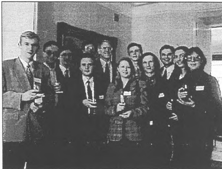
Посол США Стивен Пайфер із учасниками Посольської програми стажувань

банку України, Міністерстві економіки, Державному комітеті статистики, Фонді державного майна, Державному комітеті з розвитку підприємництва тощо. Влітку 1997 року два студенти-стажери були радниками міністра економіки України Юрія Єханурова;