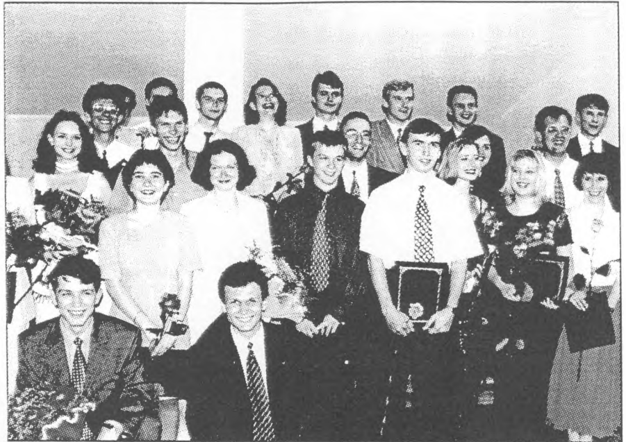
Випускники програми EERC 1999 року

вання будь-яких регуляторних інструментів має бути обгрунтовано.