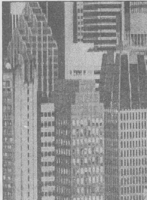
Нью-Йорк. Вид збоку.

маленький нінзя у чорному кімоно і треніках. Поряд стоїть Вчитель та щулиться з- під бороди. (Борода з вати).