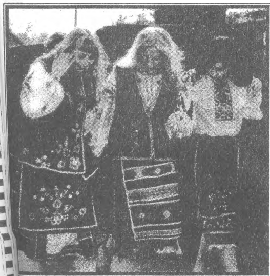
“Свята” трійця одинадцятого класу