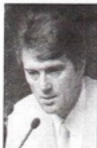
Віктор ЮЩЕНКО, лідер блоку «Наша Україна», кандидат у президенти України:

— Це сучасні технології, які в Україні будуть випробуватися вперше. І як ними маніпулювати, ми не знаємо. Я б дуже хотів, щоб політтехнологи не маніпулювали громадською думкою, а допомагали людям визначитись. (УНІАН, 31 серпня 2004 р.)