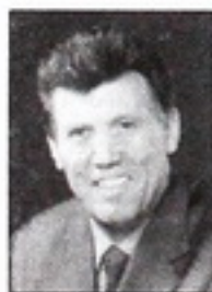
Сергій КІВАЛОВ, голова Центральної виборчої комісії:

— Згідно з Законом в день виборів заборонено оприлюднювати результати опитувань до закінчення голосування. Голосування є таємним, і будь-яка спроба відстежити процес — поза законом. Тільки Центровиборчком на основі протоколів територіальних комісій уповноважених оголошувати результати. Наголошую: тільки ЦВК. (газета «День», 17 вересня 2004 р.)