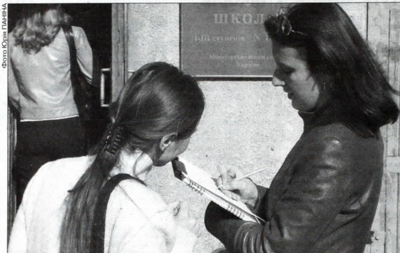
В день голосування біля виходів з виборчих дільниць 3 тисячі працівників соціологічних фірм опитають 50 тисяч виборців

Відтак виникає ще одна інтрига. Хто переможе на виборах — дуже цікаво. Але не менш цікаво й те, чи зійдуться результати опитування і підрахунку бюлетенів, заповнених на користь конкретних кандидатів. Розбіжність може означати або помилку соціологів, що буває дуже рідко, або фальсифікацію результатів голосування.