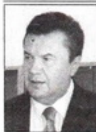
Віктор ЯНУКОВИЧ, прем'єр-міністр України, кандидат у президенти України:

— Згідно з Законом в день виборів заборонено оприлюднювати результати опитувань до закінчення голосування. Голосування є таємним, і будь-яка спроба відстежити процес — поза законом. Тільки Центровиборчком на основі протоколів територіальних комісій уповноважених оголошувати результати. Наголошую: тільки ЦВК. (газета «День», 17 вересня 2004 р.)