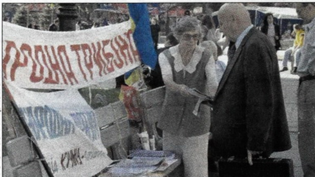
Активний виборець може знайти собі заняття не лише в день голосування. Зараз – час агітаторів

голова організації Партії Зелених у Мелітополі, який має великий досвід участі у виборчих кампаніях. – Це велика сила, якщо він досконало знає закон. За великим рахунком, спостерігачі стежать за ходом голосування не для того, щоб його зірвати, а щоб боротьба проходила чесно».