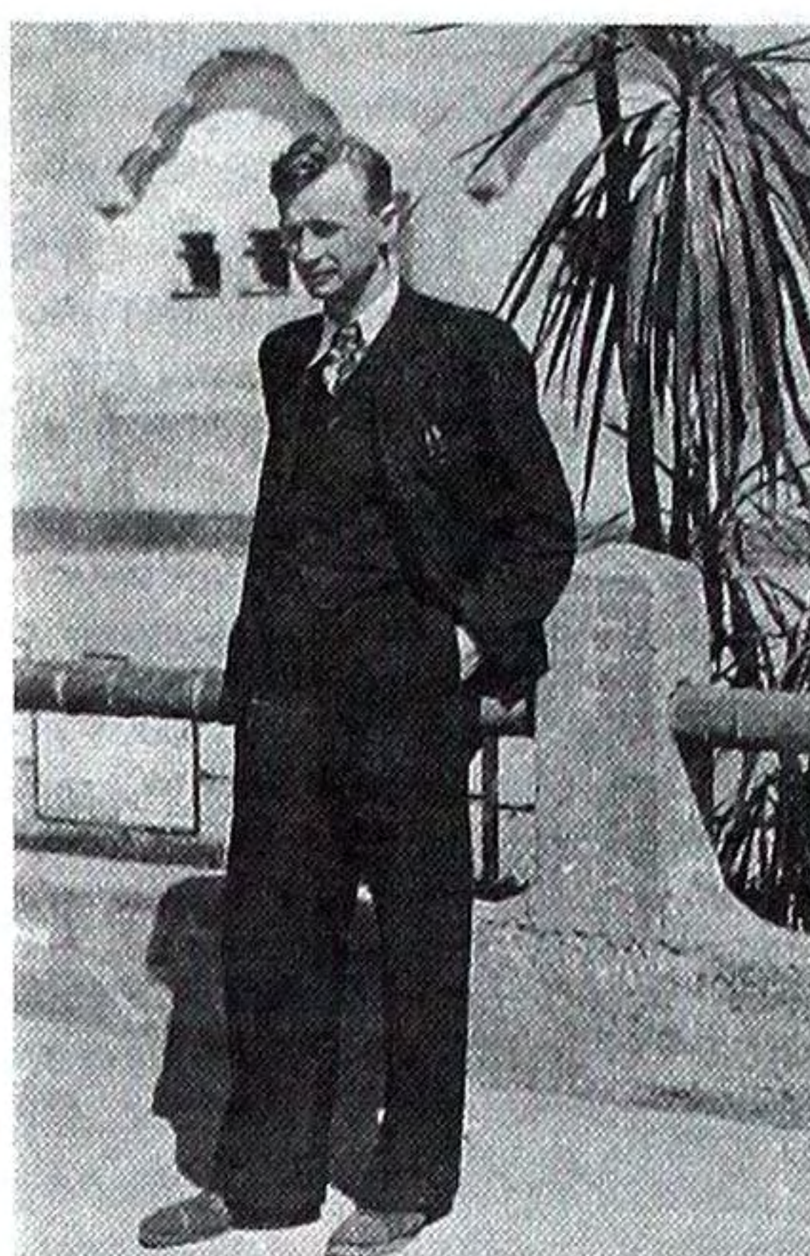
Олег Ольжич в Італії. 1937 (?)