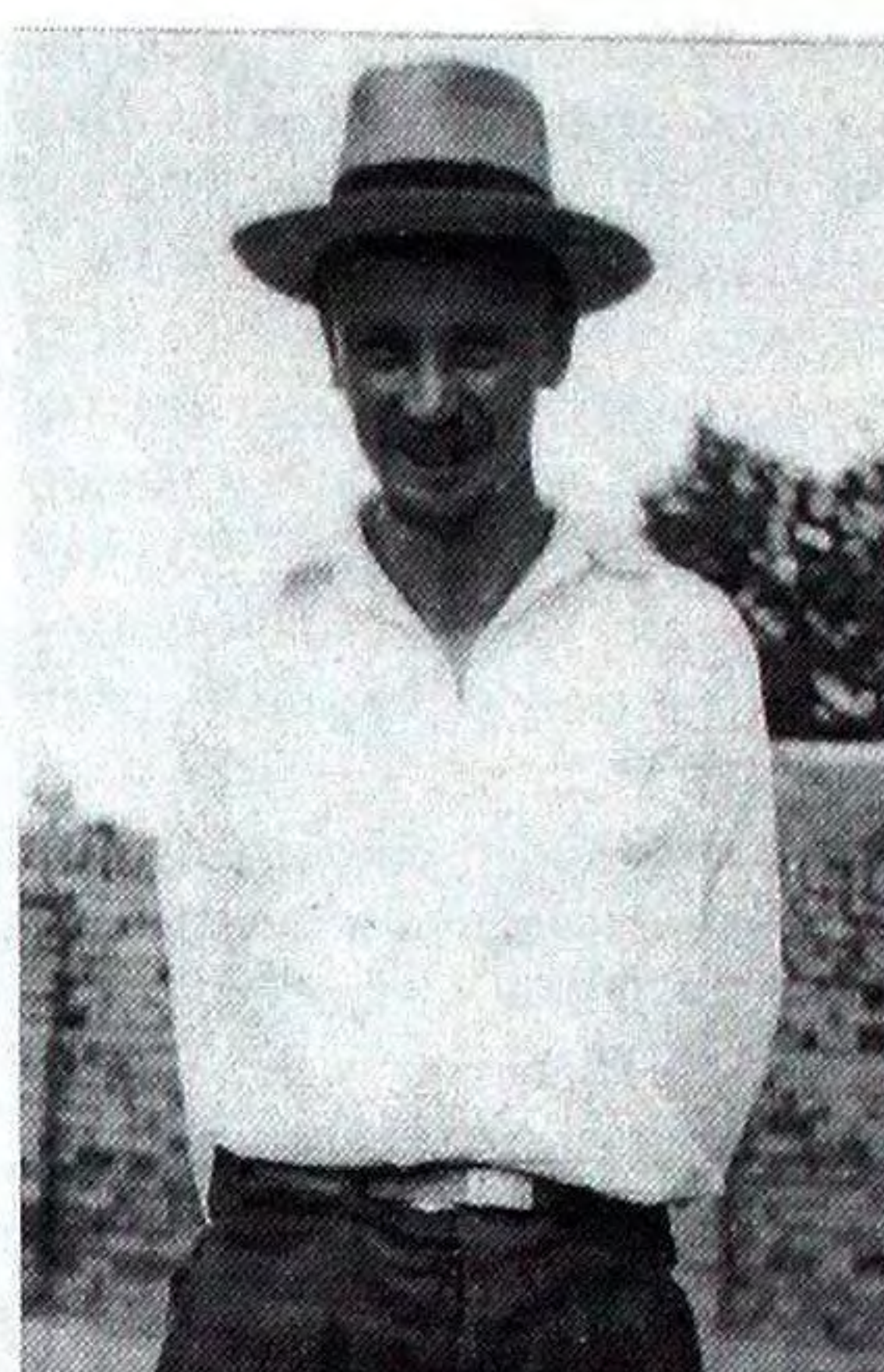
Олег Ольжич. 'Старчево, Югославія. 1932-1933. Розкопки Американської експедиції.

Є в історії постаті особливі, в яких поєднується різнобічна практична діяльність, але в яких особливо вражає діяльність душі. До таких належить Олег Ольжич. Поет, видатний вчений-археолог, підпільник-борець. Але не буде перебільшенням сказати, що насамперед це - особистість, яка стала прикладом самозреченого служіння Україні. Природа наділила Олега Ольжича щедро: потужним інтелектом, поетичним талантом, доля дарувала успішну наукову кар'єру, щастя взаємного кохання, відданих друзів, зрештою, родину. І людина все це приносить на олтар свободи своєї землі, й це не фанатизм, а результат глибоко усвідомленого вибору. Зрозуміло, що така постать лишає дуже помітний слід у житті суспільства й інтерес до цієї особистості непроминущий.