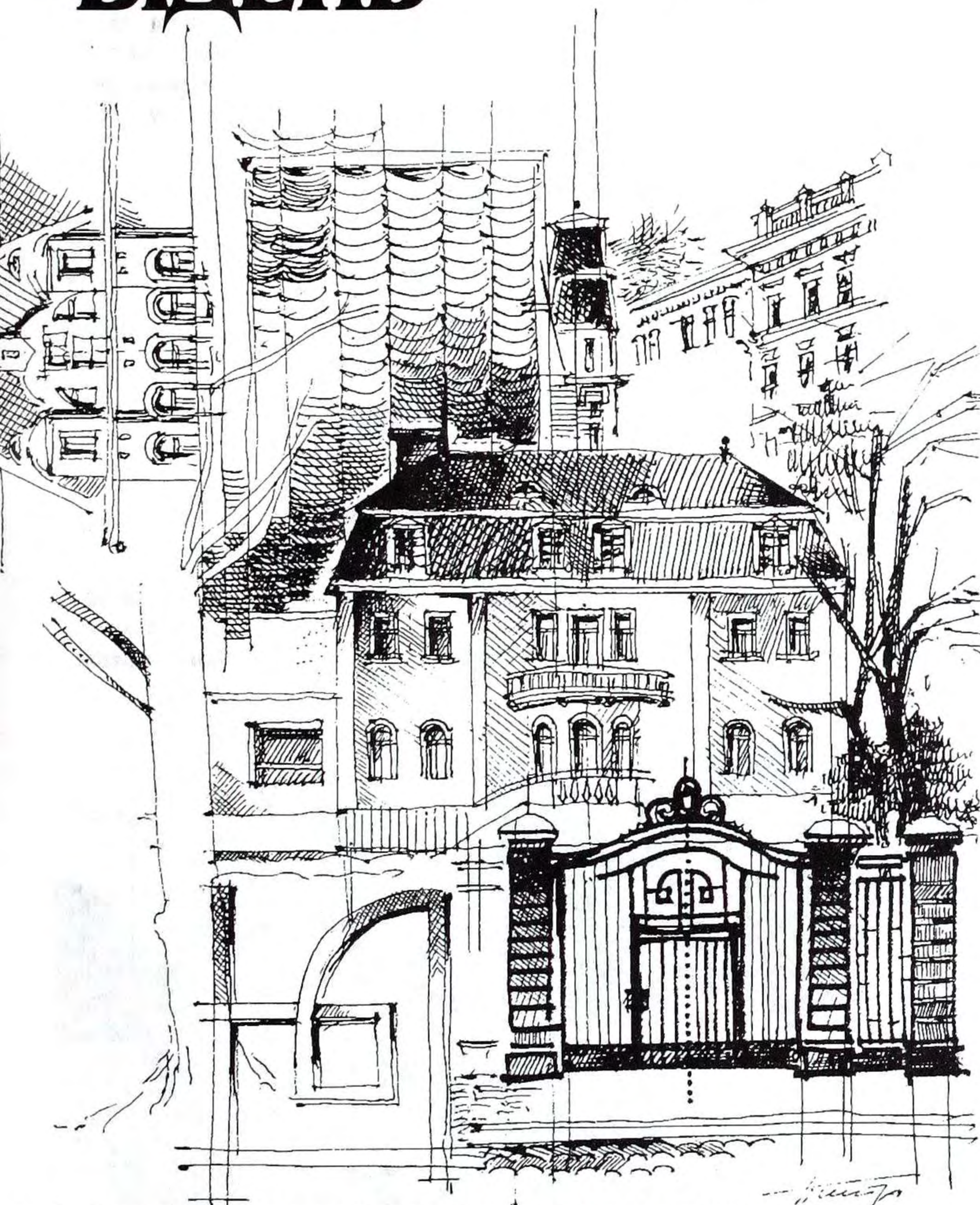
Будинок посольства України в Австрії. Малюнок В.Проскурякова.