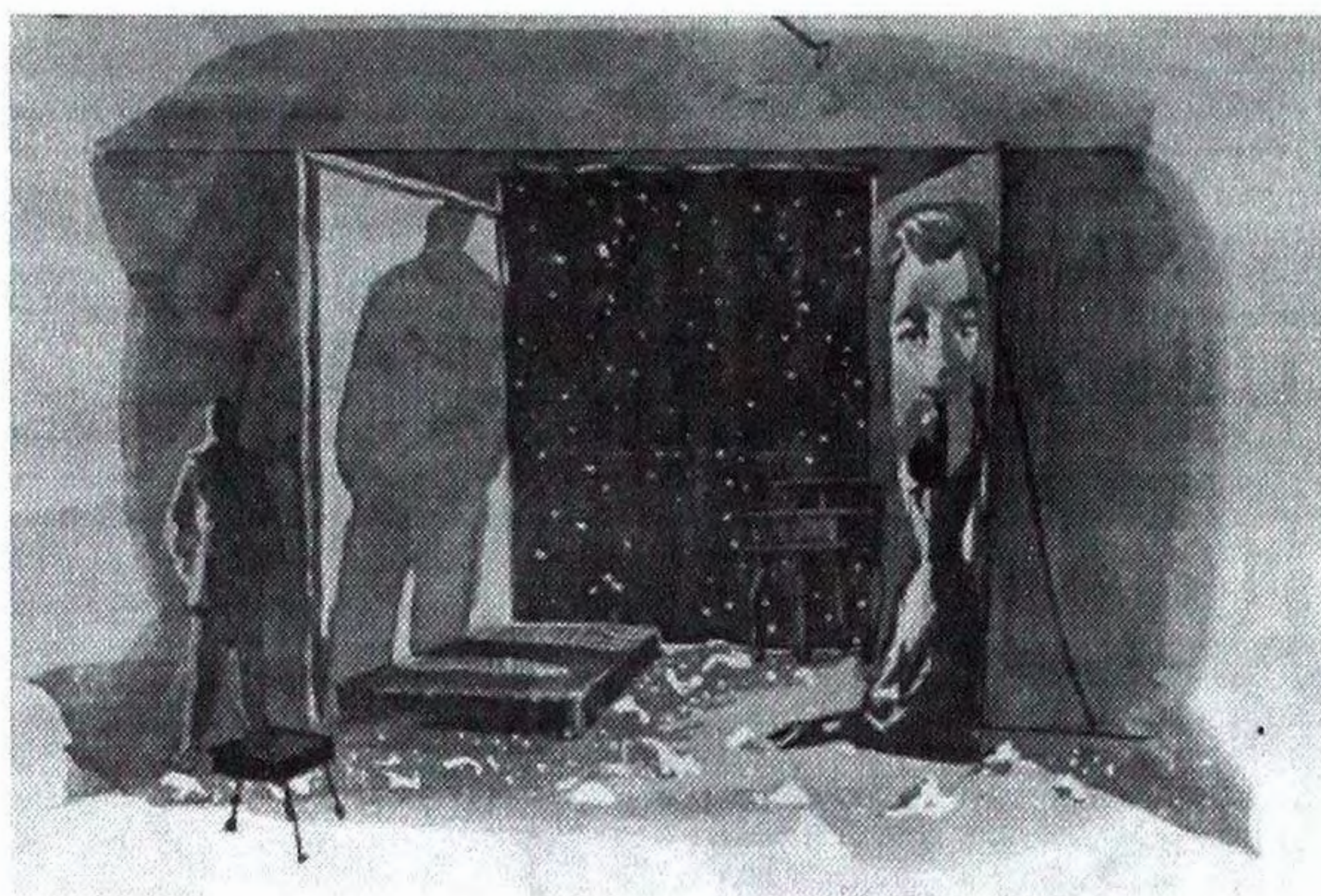
Сцена з вистави "Безталанна" за І.Карпенком-Карим. Київський театр драми і комедії.