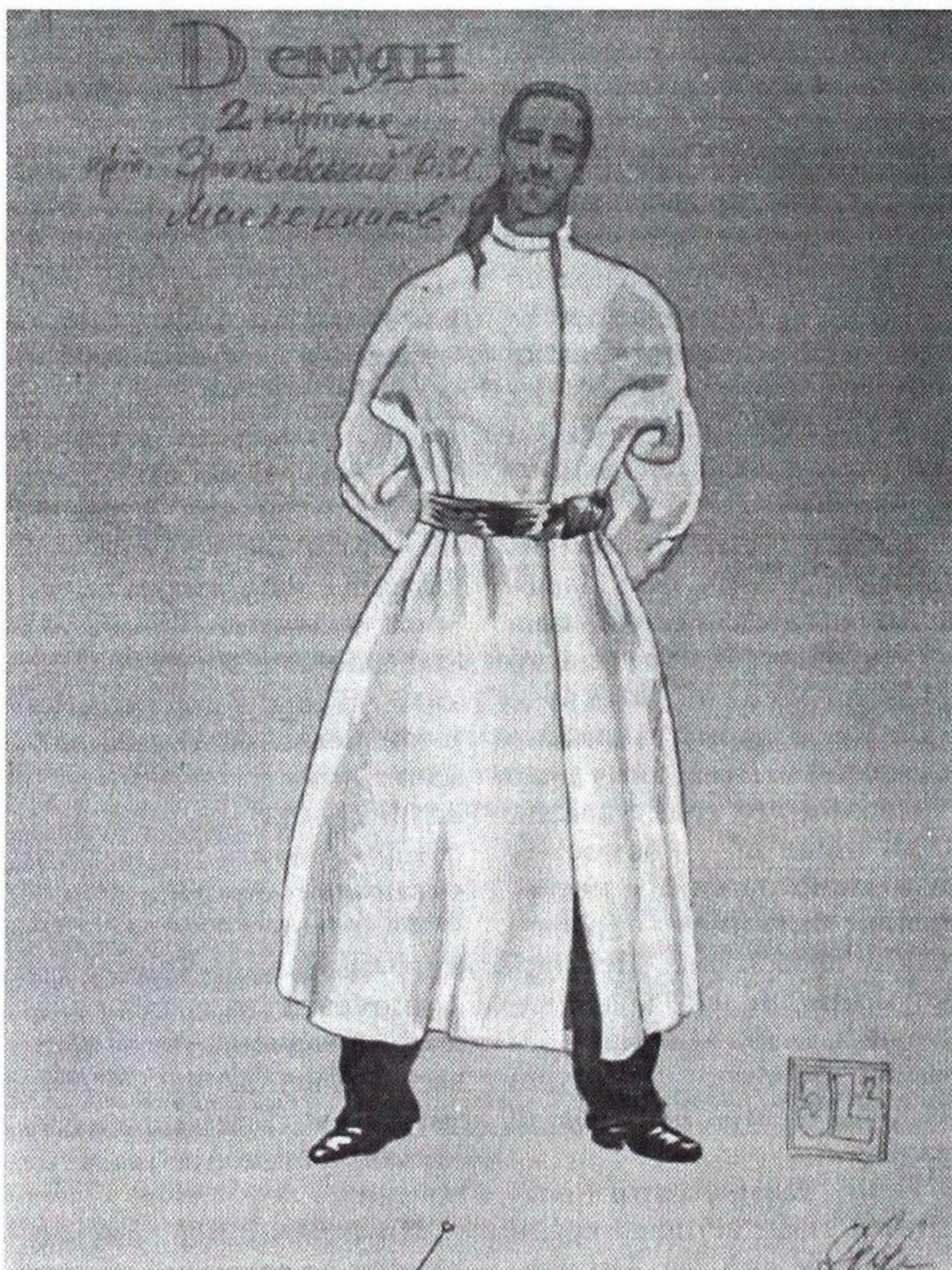
Костюм Дем'яна до вистави "Чарівниця" за п'єсою І.Карпенка-Карого. Київський театр драми і комедії.

класичної української п'єси. Декорації до "Олеси" (режисер Д.Лазорко) і "Чарівниці" (режисер Д.Богомазов) руйнують умовну традицію постановки п'єс корифеїв українського театру, відмежовують зовнішній вигляд цих вистав від "шароварної" традиції, перетворюючи "мелодрами із селянського життя" на серйозні драматичні полотна. Очищені від побутовості й етнографізму, від стильових прикмет часу, що породили п'єси, вистави йдуть від побуту до буття.