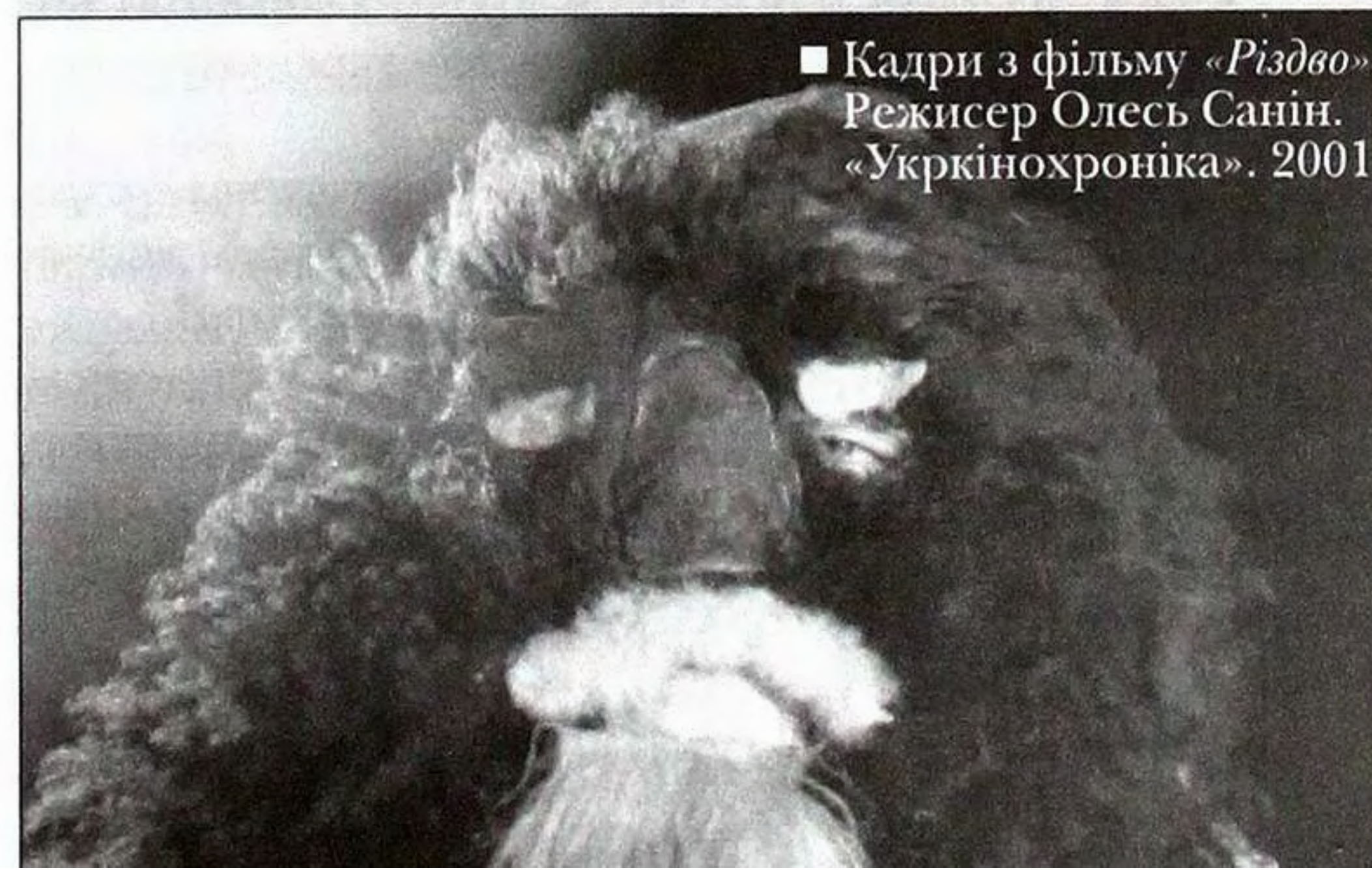
■ Кадри з фільму «Різдво». Режисер Олесь Санін. «Укркінохроніка». 2001.